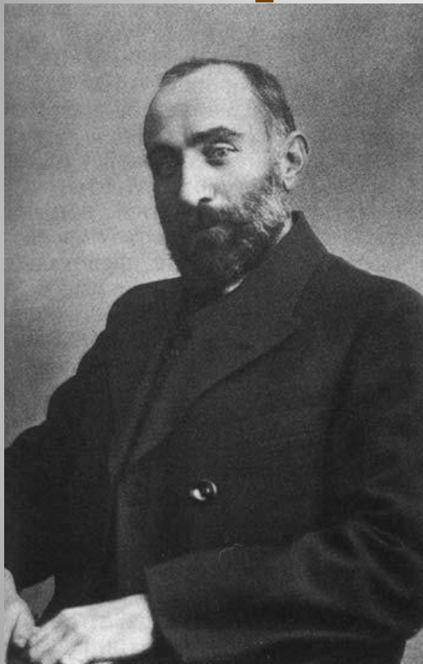
Чхеидзе Николай Семенович