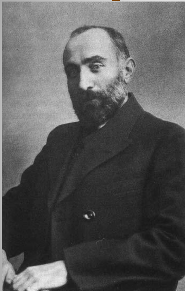
Чхеидзе Николай Семенович