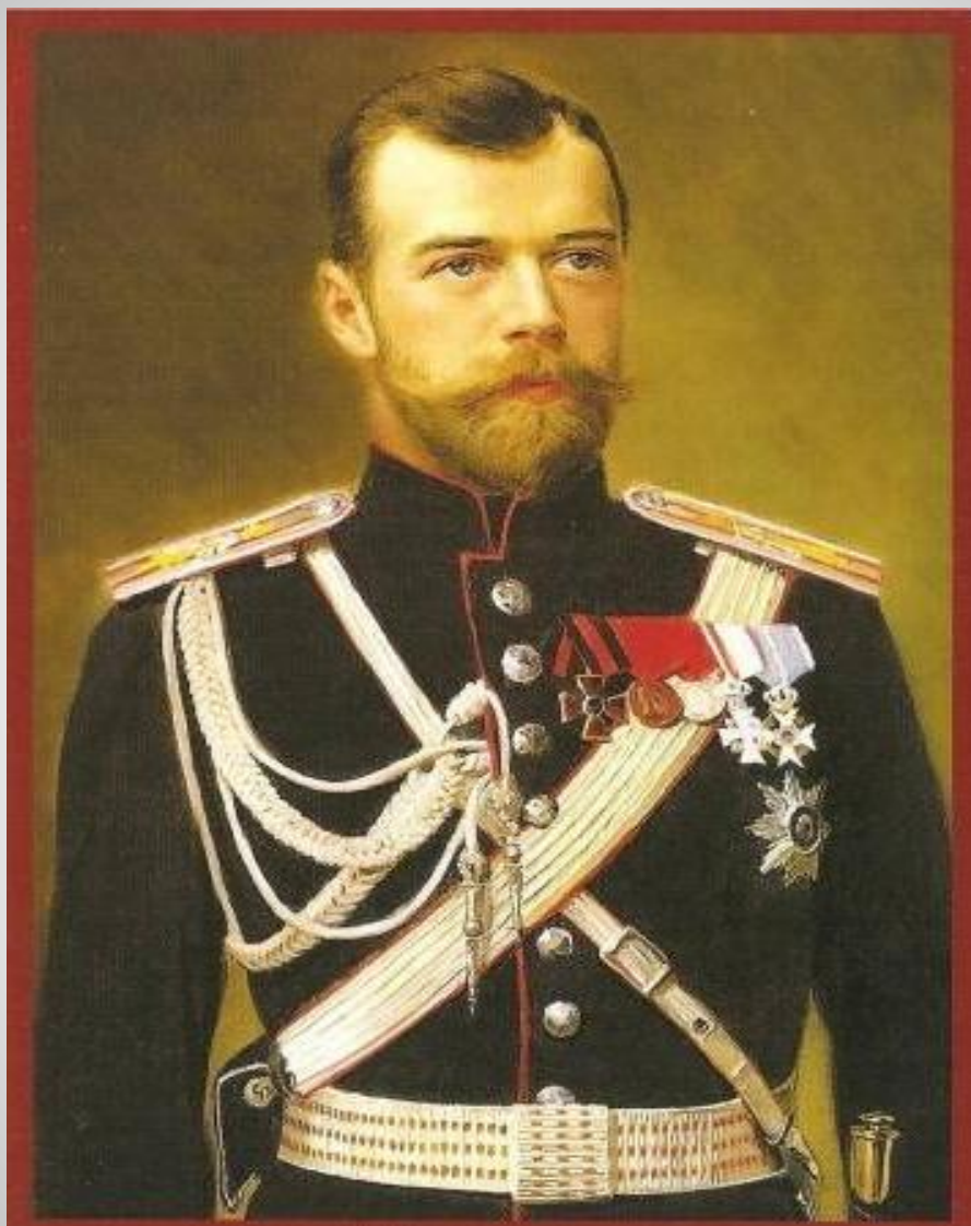
Император Николай II (1868 – 1918)