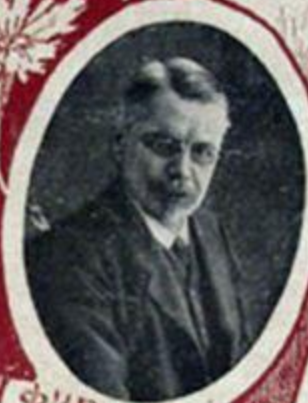
Ф. И. РОДИЧЕВЪ, министръ путей сообщения.