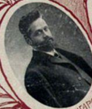
А. М. ШИНГАРЕВЪ, министръ земледѣлія.