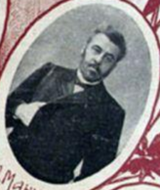
А. А. МАНУИЛОВЪ, министръ путей сообщения.