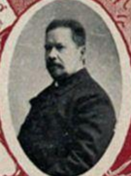
И. В. ГОДЕВЪ, государств. канцлеръ.