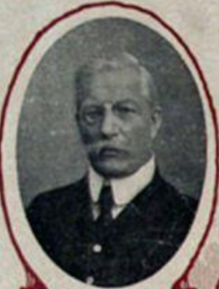
П. Н. МИЛЮКОВЪ, министръ иностранныхъ дѣлъ.