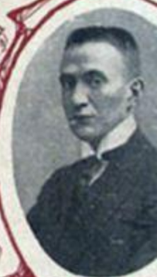
А. Ф. КЕРЕНСКІЙ, офицеръ артиллеріи.