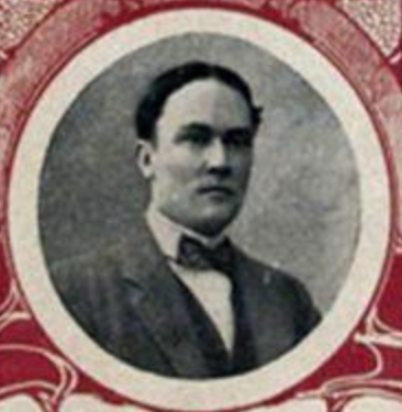
М. В. ТЕРЕЩЕНКО, министръ финансовъ.