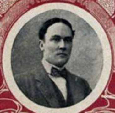
М. В. ТЕРЕЩЕНКО, министръ финансовъ.