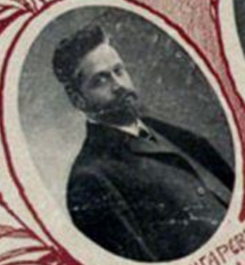
А. М. ШИНГАРЕВЪ, министръ земледѣлія.