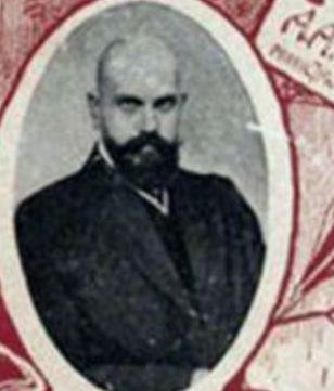
В. Н. ЛЬВОВЪ, офицеръ-прокуроръ въ Совѣтѣ.