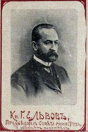
Кн. Г. ЕЛЬВОВЪ, Предсѣдатель Совѣта министровъ, и министръ внутреннихъ дѣлъ.