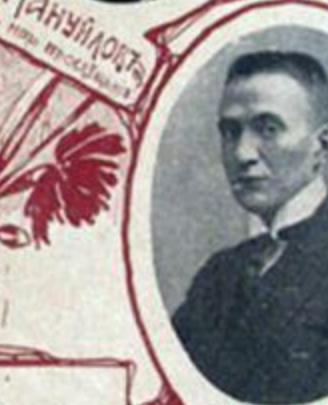
А. Ф. КЕРЕНСКІЙ, генералъ-адъютантъ.