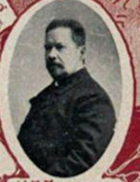
И. В. ГОДЕВЪ, посланникъ въ Берлинъ.