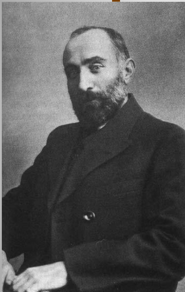
Чхеидзе Николай Семенович