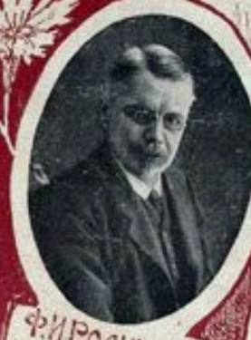
Ф. И. РОДИЧЕВЪ, Министръ путей сообщения