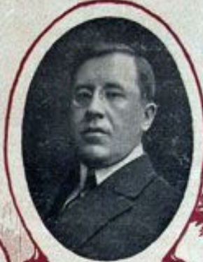
А. И. КОНОВАЛОВЪ, Министръ торговли и промышленности