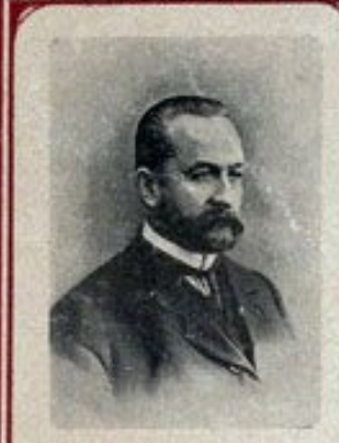
К. Г. ЛЬВОВЪ, Председатель Совета министровъ, Министръ внутреннихъ дѣлъ