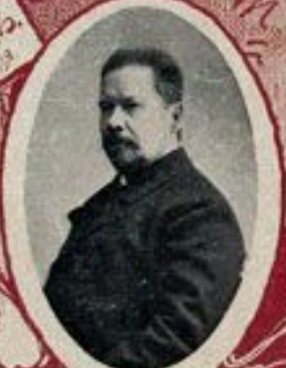
И. В. ГОДЕВЪ, Государственный канцлеръ