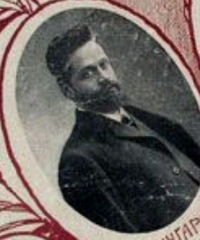
А. И. ШИНГАРЕВЪ, Министръ финансовъ