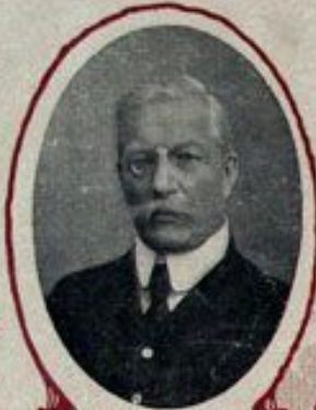
П. Н. МИЛЮКОВЪ, Министръ иностранныхъ дѣлъ