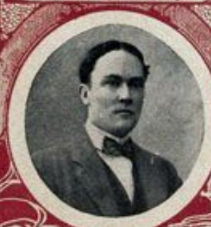
М. В. ТЕРЕШЕНКО, Министръ юстиціи