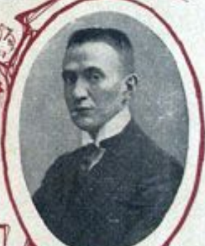
А. Ф. КЕРЕНСКИЙ, Министръ торговли