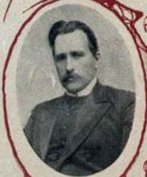
Н. В. НЕКРАСОВЪ, Министръ Сибирскаго округа