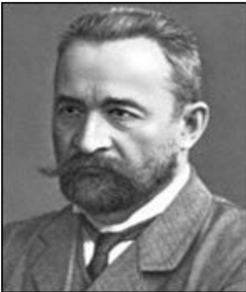
Г.Е.Львов, глава Временного правительства