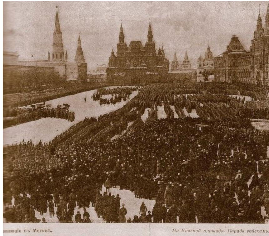
Митинг в Москвѣ.

Крайнее обострение всех противоречий российского общества, усугубленных войной, хозяйственной разрухой и продовольственным кризисом.