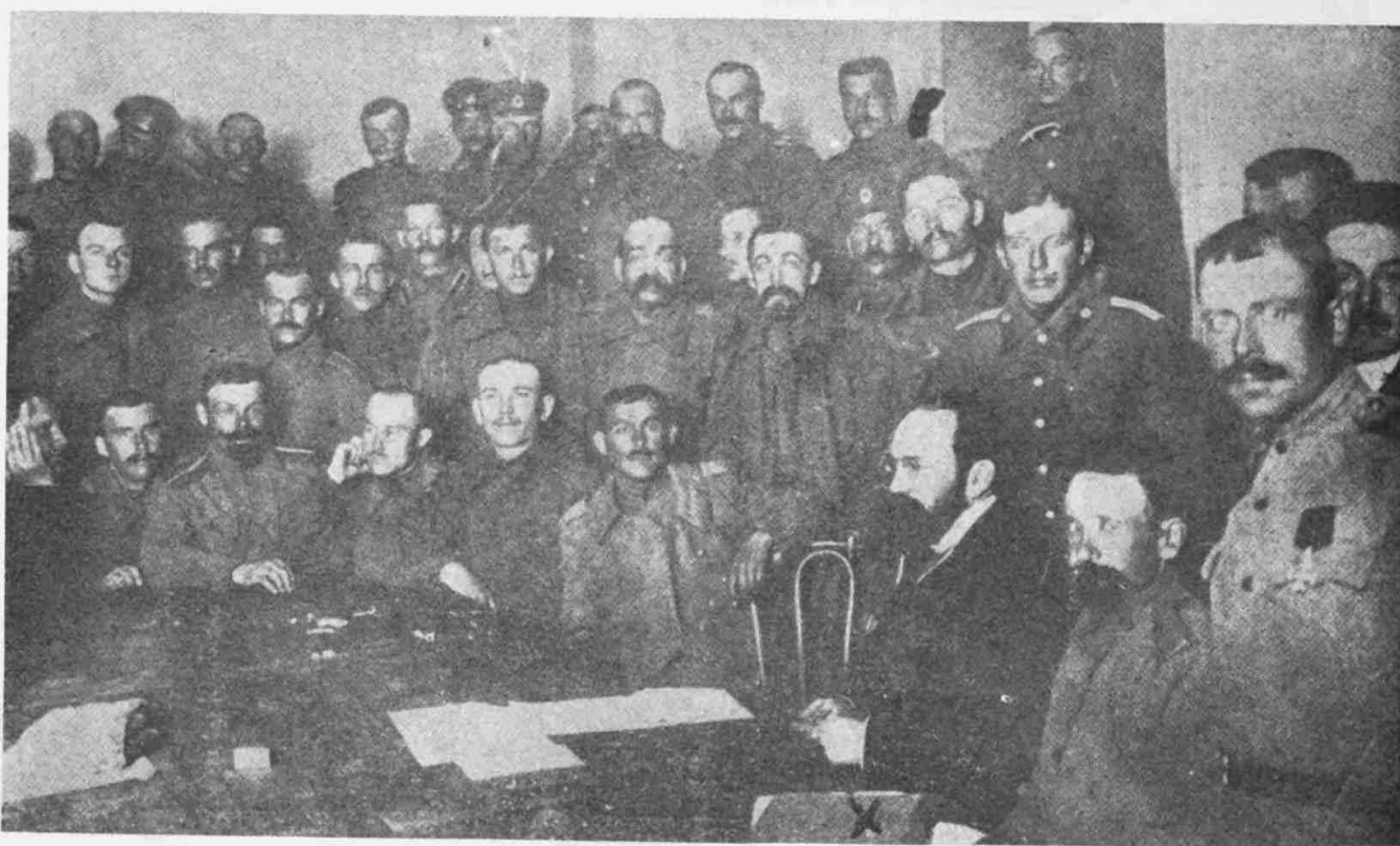
27 февраля образовался Совет Солдатских и Рабочих депутатов. Составление приказа № 1. Означенный х прие. порвах Н. П. Соловьев.