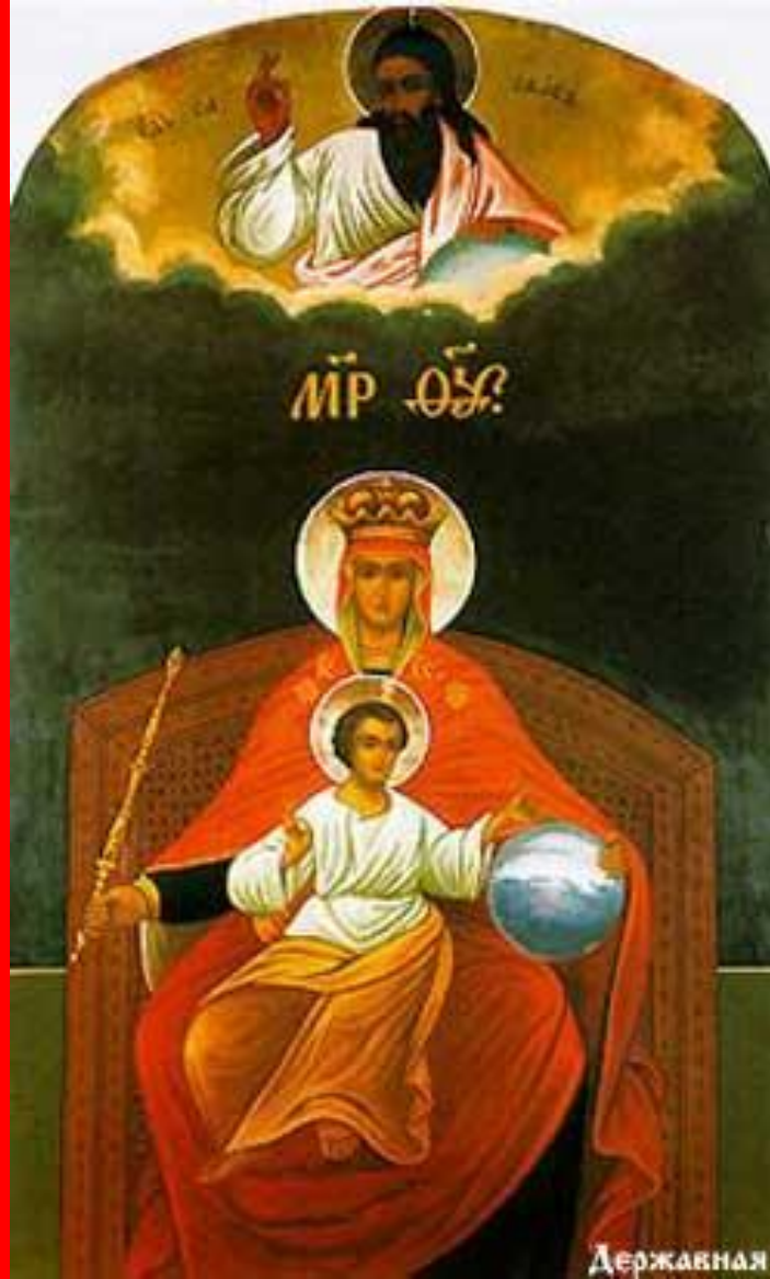
Державная икона Божьей Матери обретенная 2 марта 1917 г в селе Коломенском под Москвой