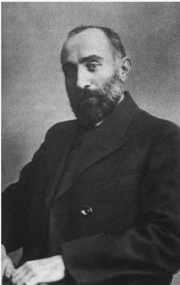
Чхеидзе Николай Семенович