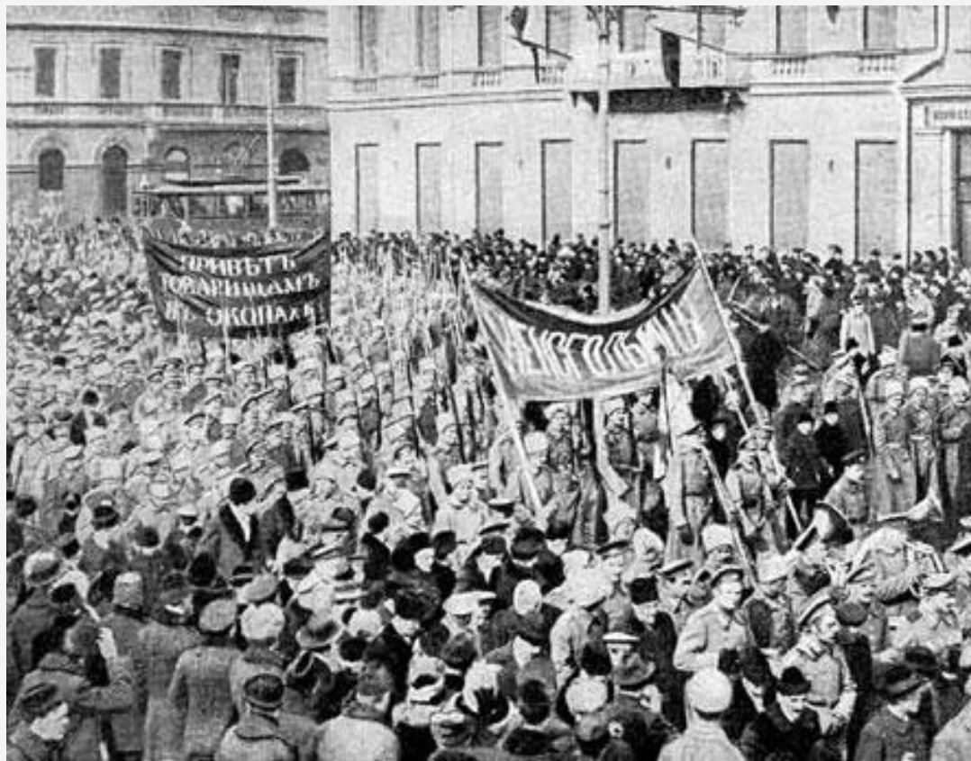
Солдатская демонстрация в Петрограде февраль 1917 года