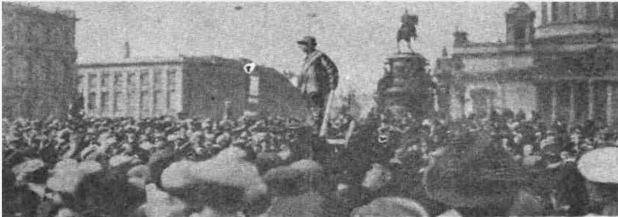
У Государственного Совета.