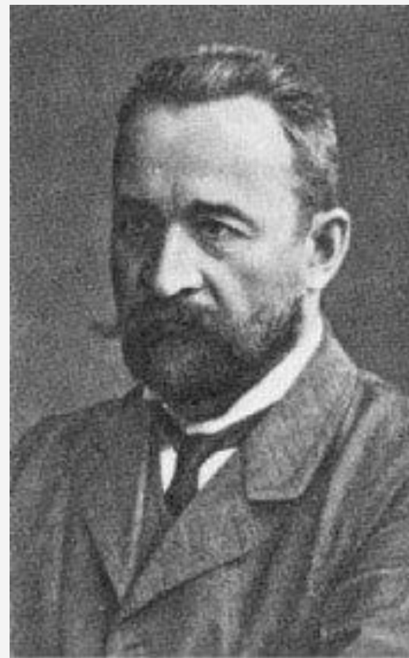
Львов Георгий Евгеньевич - князь, русский политик