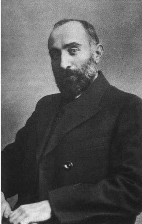
Чхеидзе Николай Семенович