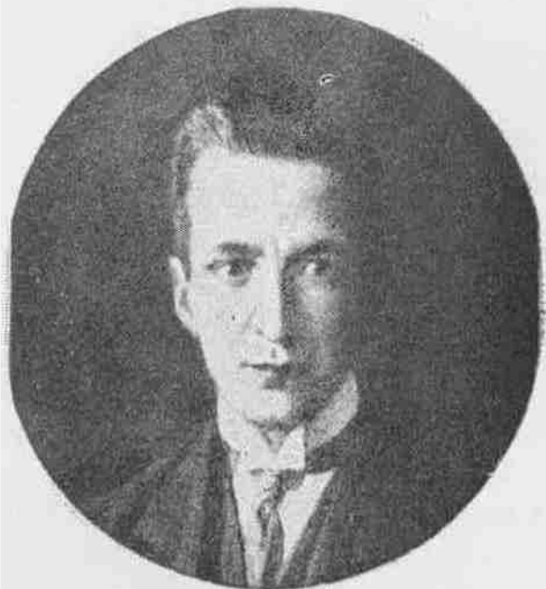
Лидер трудовиков, член партии социалистов-революционеров, Керенский