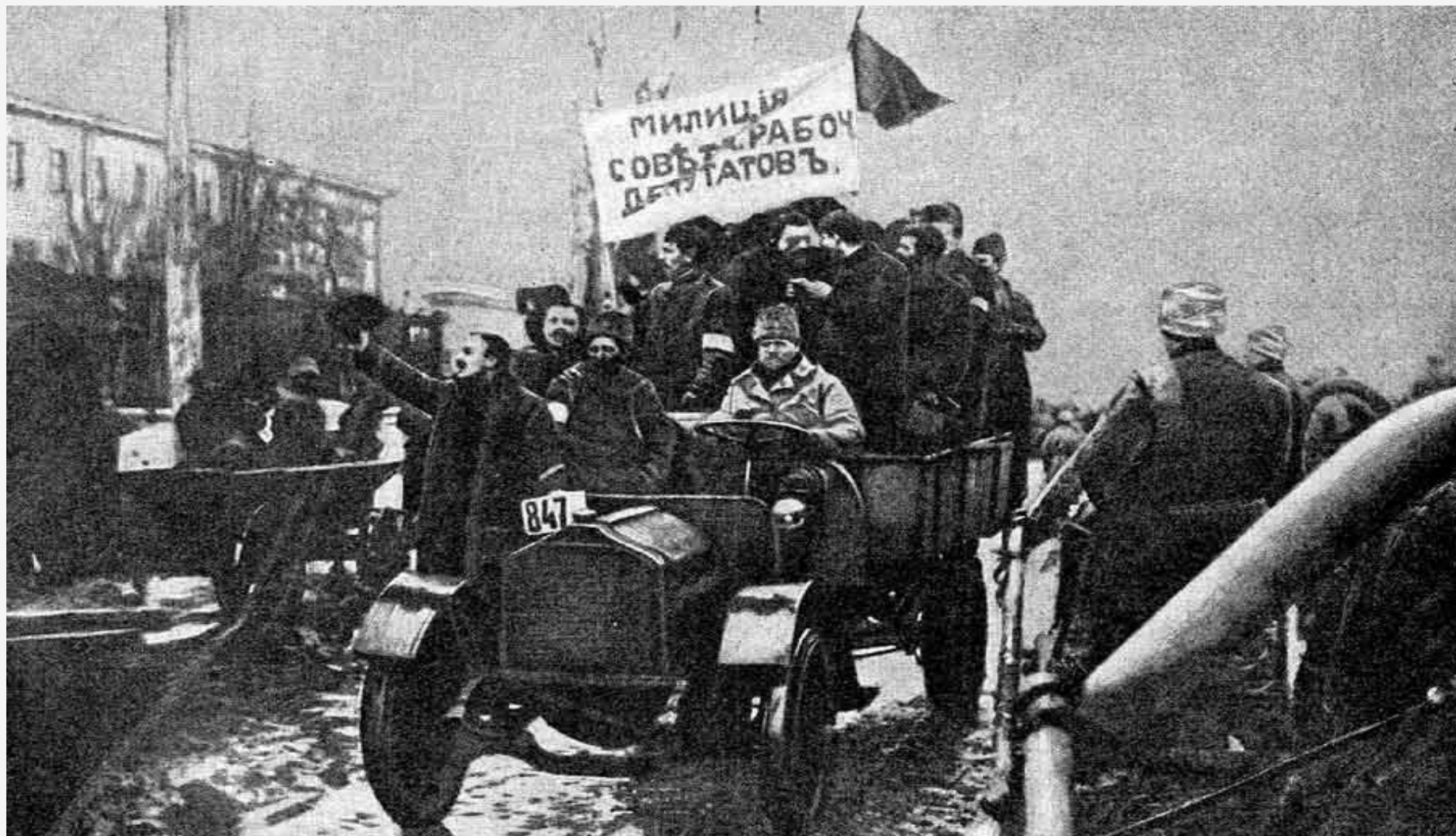
Петроград. Февраль 1917 года