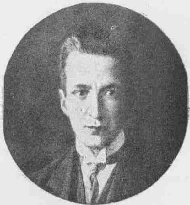
Лидер трудовиков, член партии социалистов-революционеров, Керенский