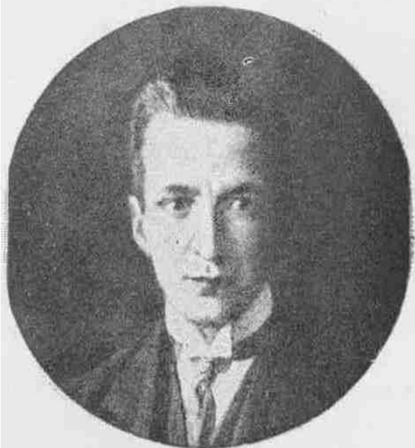
Лидер трудовиков, член партии социалистов-революционеров, Керенский