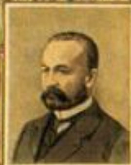
Министръ военныя дѣлъ С. С. ЗУБОВЪ.