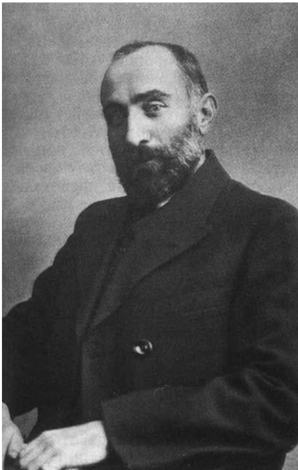
Чхеидзе Николай Семенович