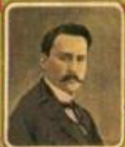
Министръ путей сообщенія Н. С. КОЩЕЕВЪ.