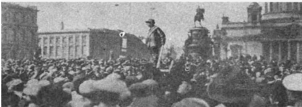
У Государственного Совета.