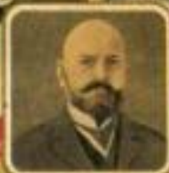
Министръ внутреннихъ дѣлъ В. Н. ПАВЛОВЪ.