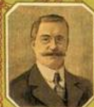
Министръ иностранныхъ дѣлъ Н. С. КОЩЕЕВЪ.