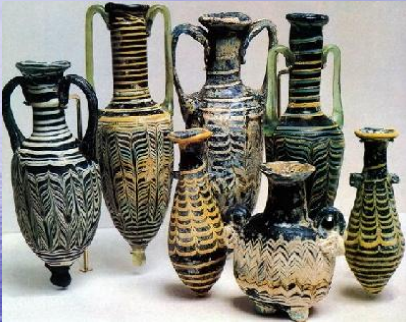
Финикийские амфоры из стекла 8 в. до н.э.