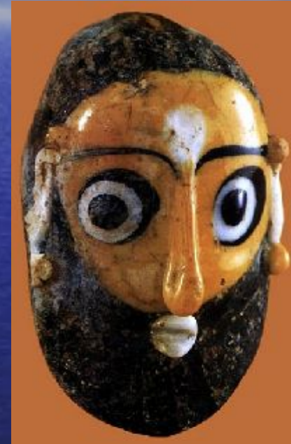
Стеклянная маска из Карфагена 3 в. до н.э.