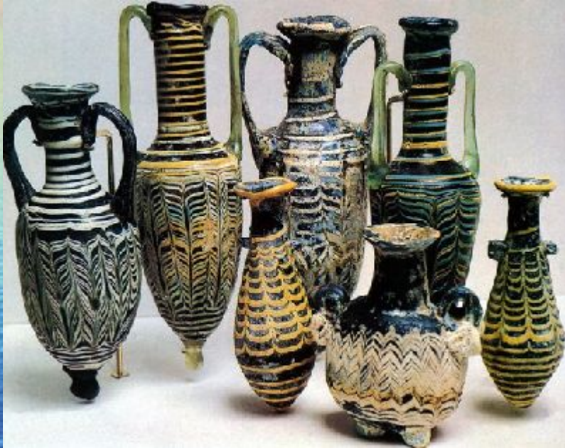
Финикийские амфоры из стекла 8 в. до н.э.