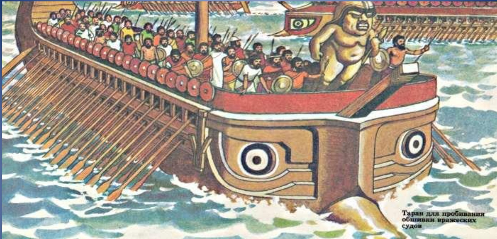
Таран для пробивания обшивки вражеских судов