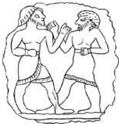
Барельеф, изображающий кулачный бой (Вавилон, II тысячелетие до н.э.)

О развитии физической культуры Вавилона свидетельствуют терракотовые изображения охоты, загона животных, стрельбы из лука, кулачного боя и состязания на колесницах.