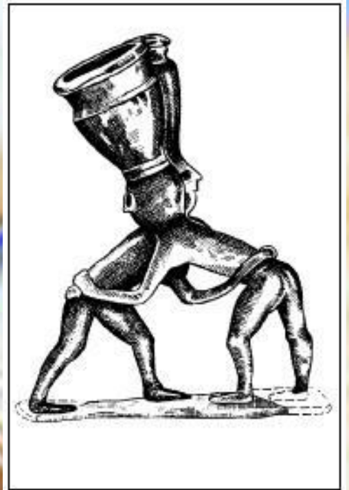
Бронзовая скульптура из Месопотамии, увечковечившая борьбу на поясах (начало III тысячелетия до н.э.)

Этому же району принадлежит самый древний памятник культа борьбы на поясах, в основе которой лежали боевые приемы пленения противника, – бронзовая статуя, изготовленная примерно в 2800 году до н.э. (сейчас она выставлена в Багдадском музее).