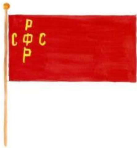
Государственный флаг РСФСР (1918г.)

С установлением советской власти Государственным флагом стал флаг красного цвета с изображением серпа и молота