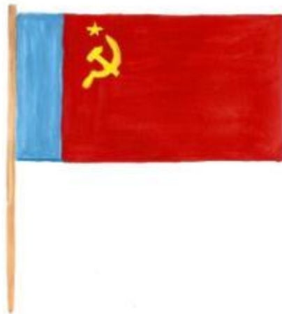
Государственный флаг РСФСР (1954г.)