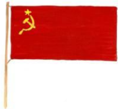
Государственный флаг СССР