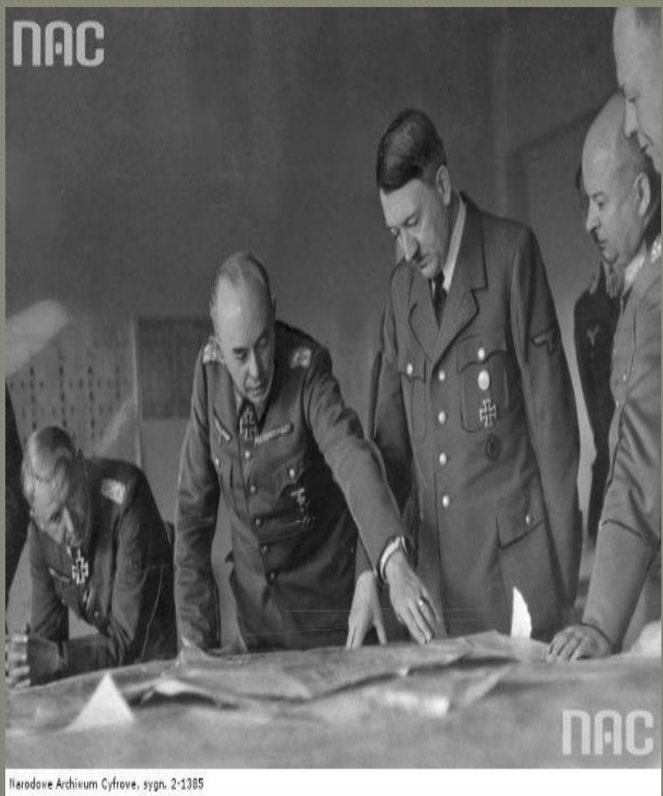
Narodowe Archiwum Cyfrowe, sygn. 2-1385