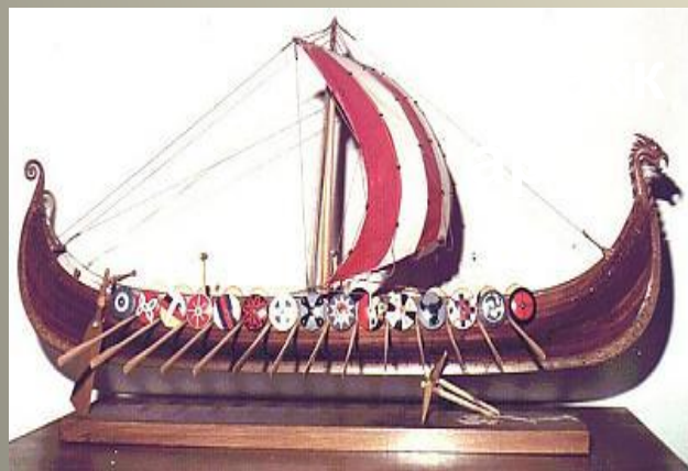
ВИКИНГИ В ЕВРОПЕ, VIII - XII ВВ.