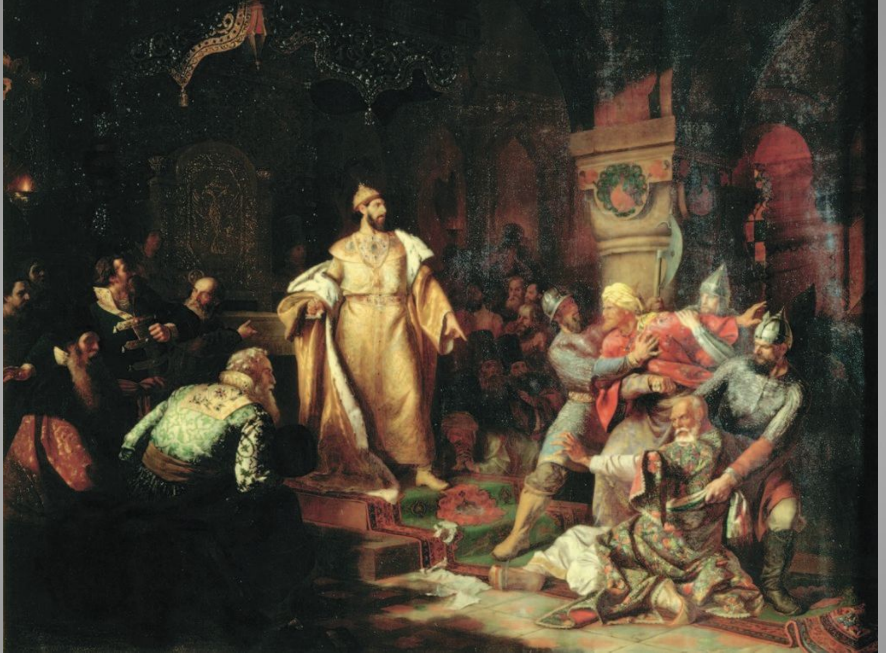
Иоанн III разрывает ханскую грамоту. Худ. Н.С. Шустов. 1862г.