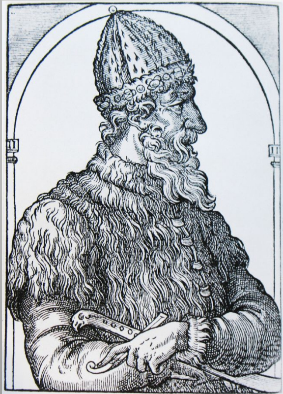
Иван III. Гравюра XVI в.

- великий князь московский (с 1462 г.), государь всея Руси. При Иване III Русское государство окончательно преодолело зависимость от ордынских ханов, Москва стала центром единого Российского государства.