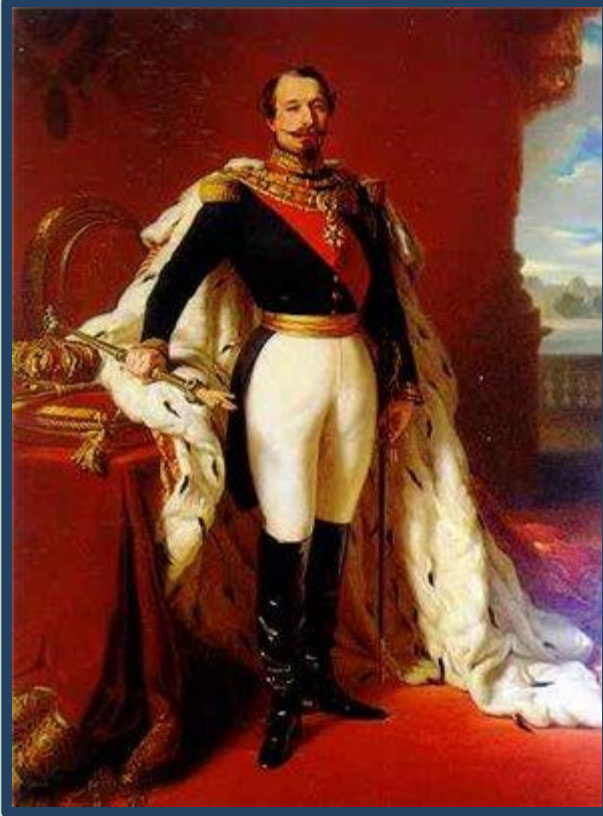
Шарль-Луи Наполеон Бонапарт.

В 1849г. президентом французской республики был избран Луи Наполеон «маленький племянник большого дяди», как его называли в народе. Он был честолюбив и мечтал о троне. В 1851г. Луи Наполеон потребовал удалить из Конституции статьи, ограничивающие продолжительность его власти. Не получив поддержки в Законодательном собрании, он совершил государственный переворот – распустил Законодательное собрание и взял всю полноту власти в свои руки.