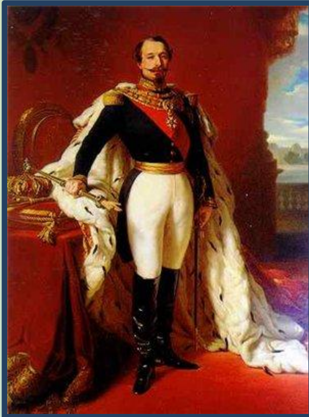
Шарль-Луи Наполеон Бонапарт.

Франции. В 1849г. президентом французской республики был избран Луи Наполеон «маленький племянник большого дяди», как его называли в народе. Он был честолюбив и мечтал о троне. В 1851г. Луи Наполеон потребовал удалить из Конституции статьи, ограничивающие продолжительность его власти. Не получив поддержки в Законодательном собрании, он совершил государственный переворот – распустил Законодательное собрание и взял всю полноту власти в свои руки.