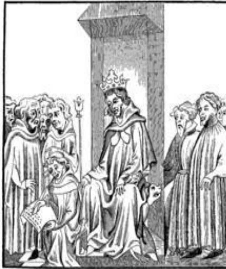
Fig. 7.—The King of the Franks, in the midst of the Military Chiefs who formed his Trouvée , or armed Court, dictates the Salic Law (Code of the Barbaric Laws).—Fac-simile of a Miniature in the "Chronicles of St. Denis," a Manuscript of the Fourteenth Century (Library of the Arsenal).