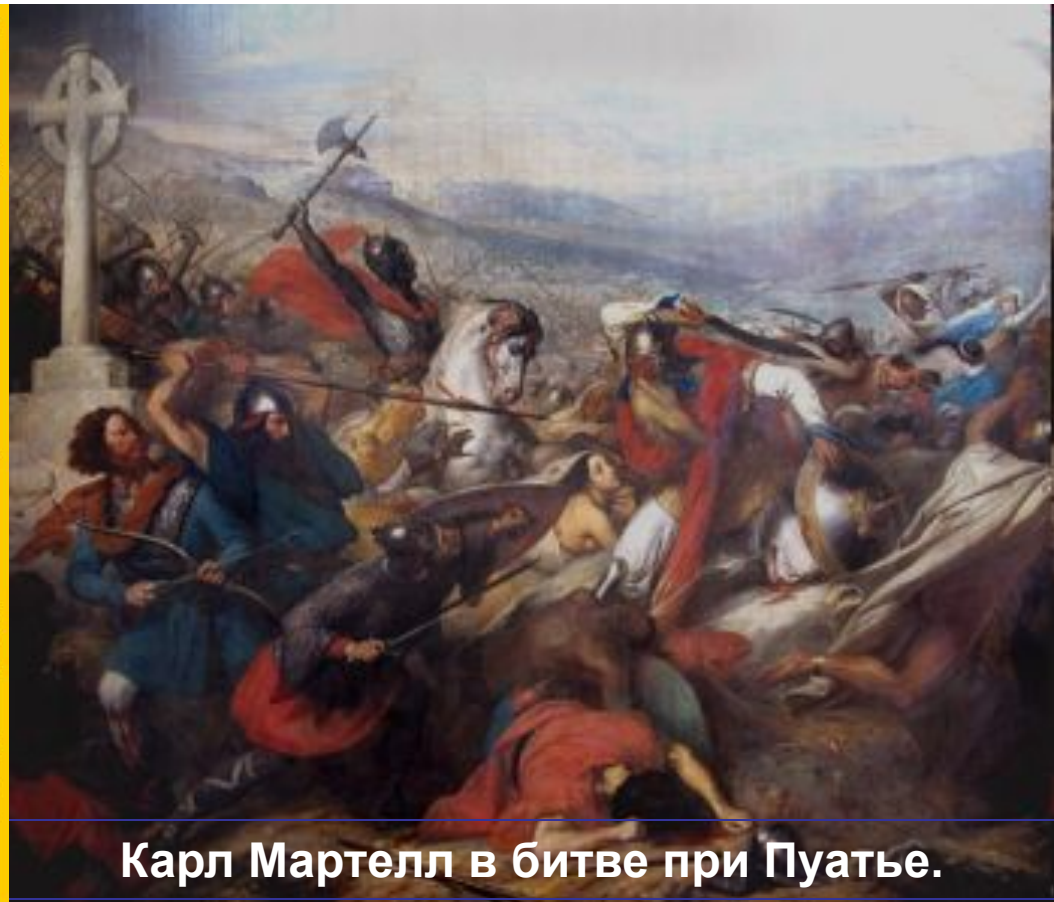
Карл Мартелл в битве при Пуатье.