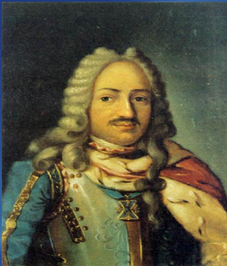
Франц Яковлевич Лефорт (2 января 1656 - 12 марта 1699)