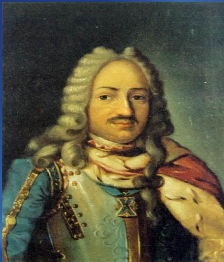
Франц Яковлевич Лефорт (2 января 1656 - 12 марта 1699)