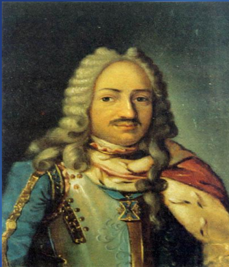
Франц Яковлевич Лефорт (2 января 1656 - 12 марта 1699)