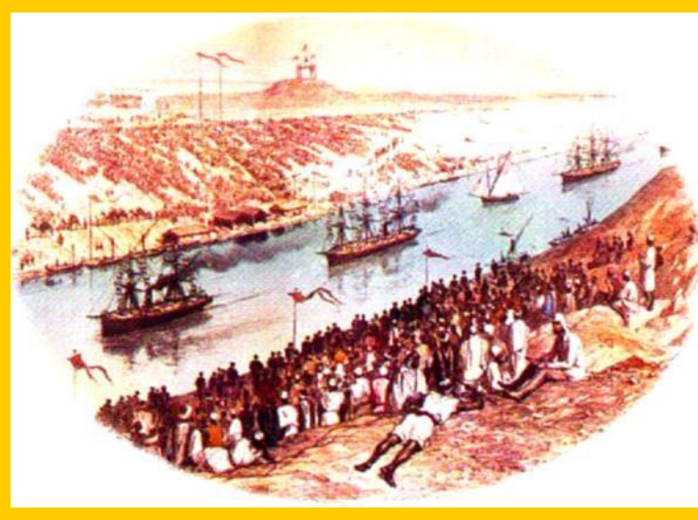
Открытие Панамского канала

Во время 3-ей республики экономика развивалась быстрыми темпами и Франция вышла на 4-е место в мире.