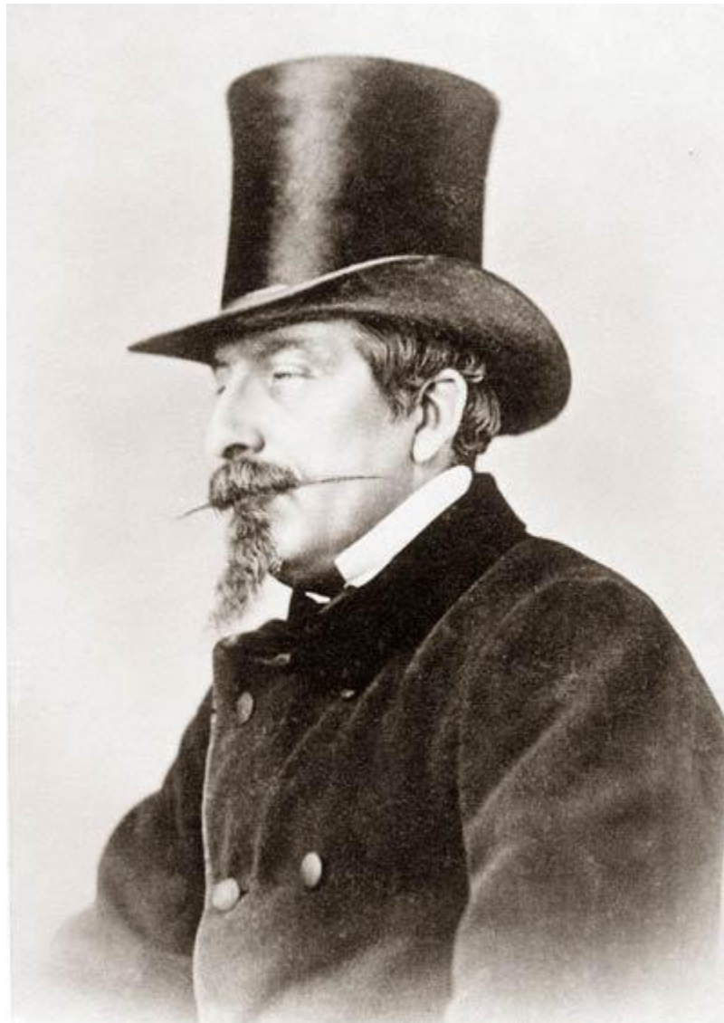
Луи Наполеон Бонапарт