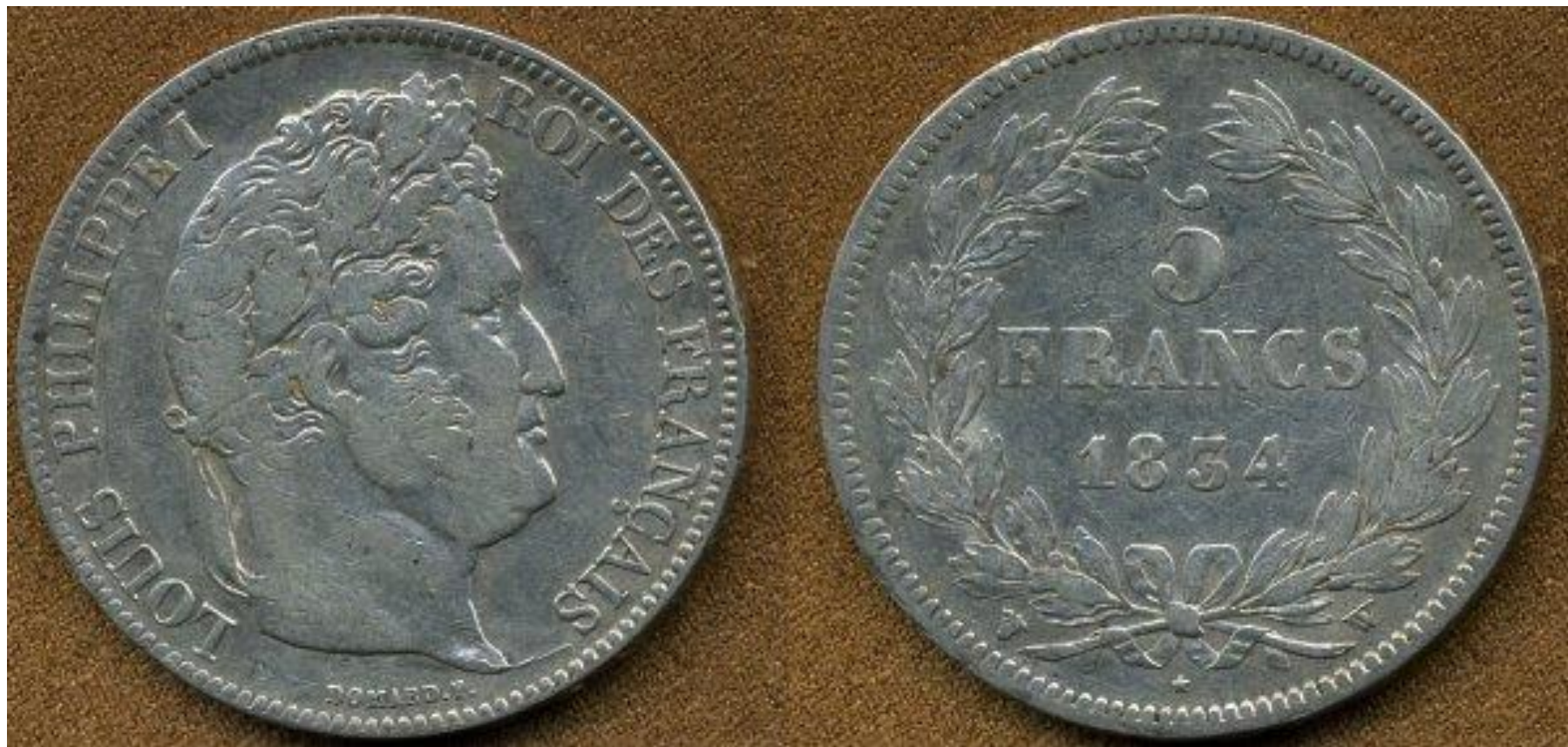
Монеты Луи Филиппа