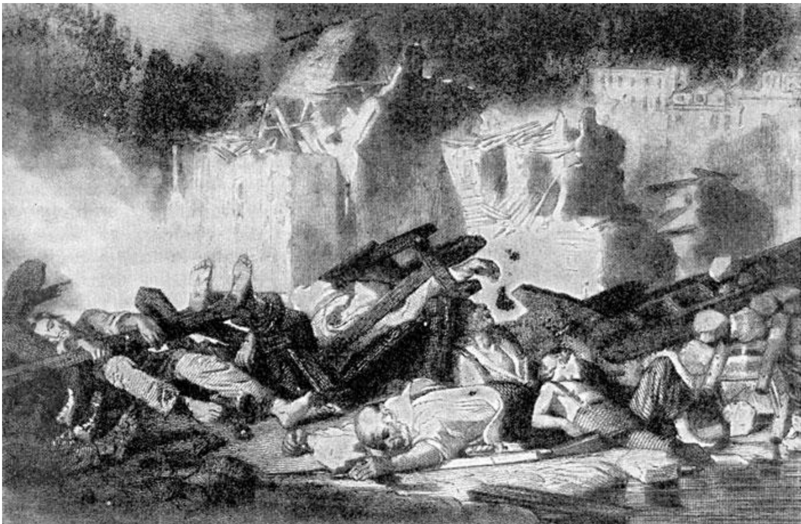
Расправа с лионскими ткачами, 1834 г.