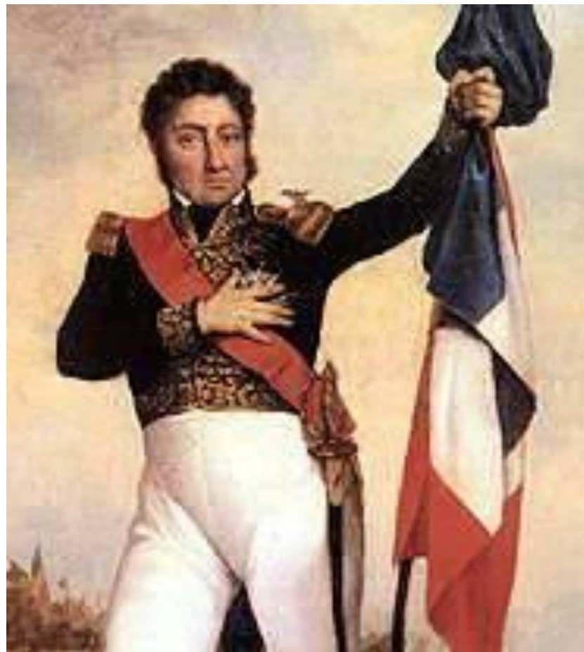
Луи Филипп на баррикадах