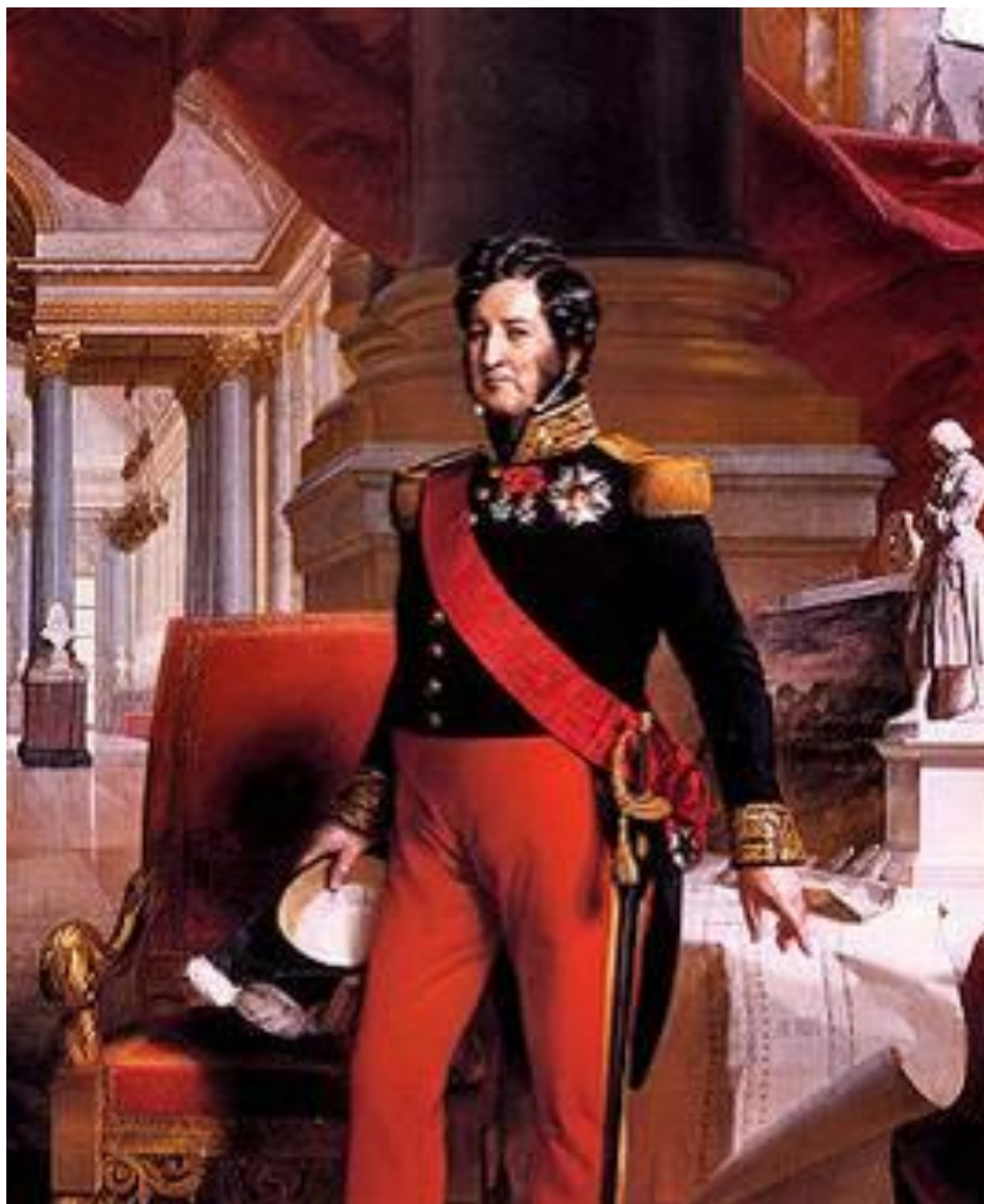
Луи Филипп Орлеанский