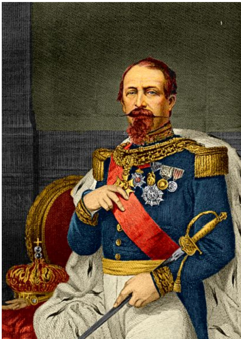
Император Наполеон III