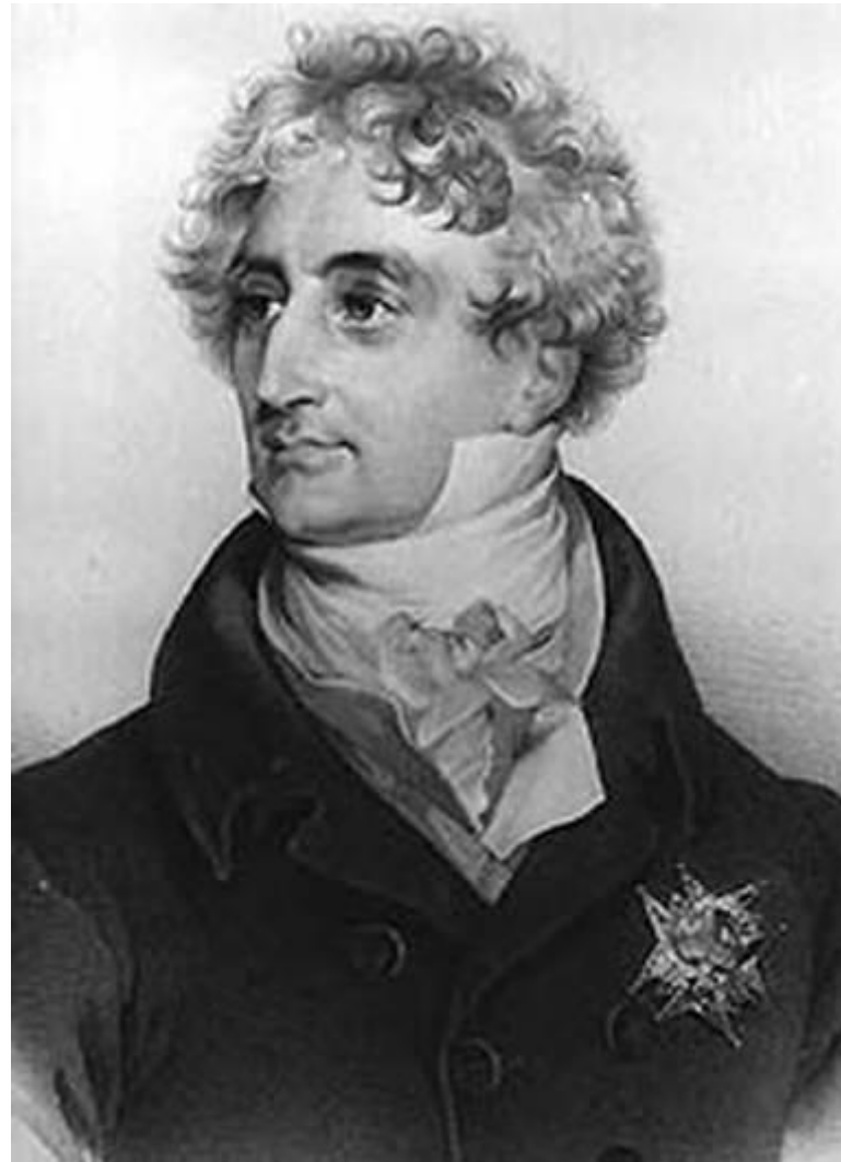
Арман Эммануэль Ришелье