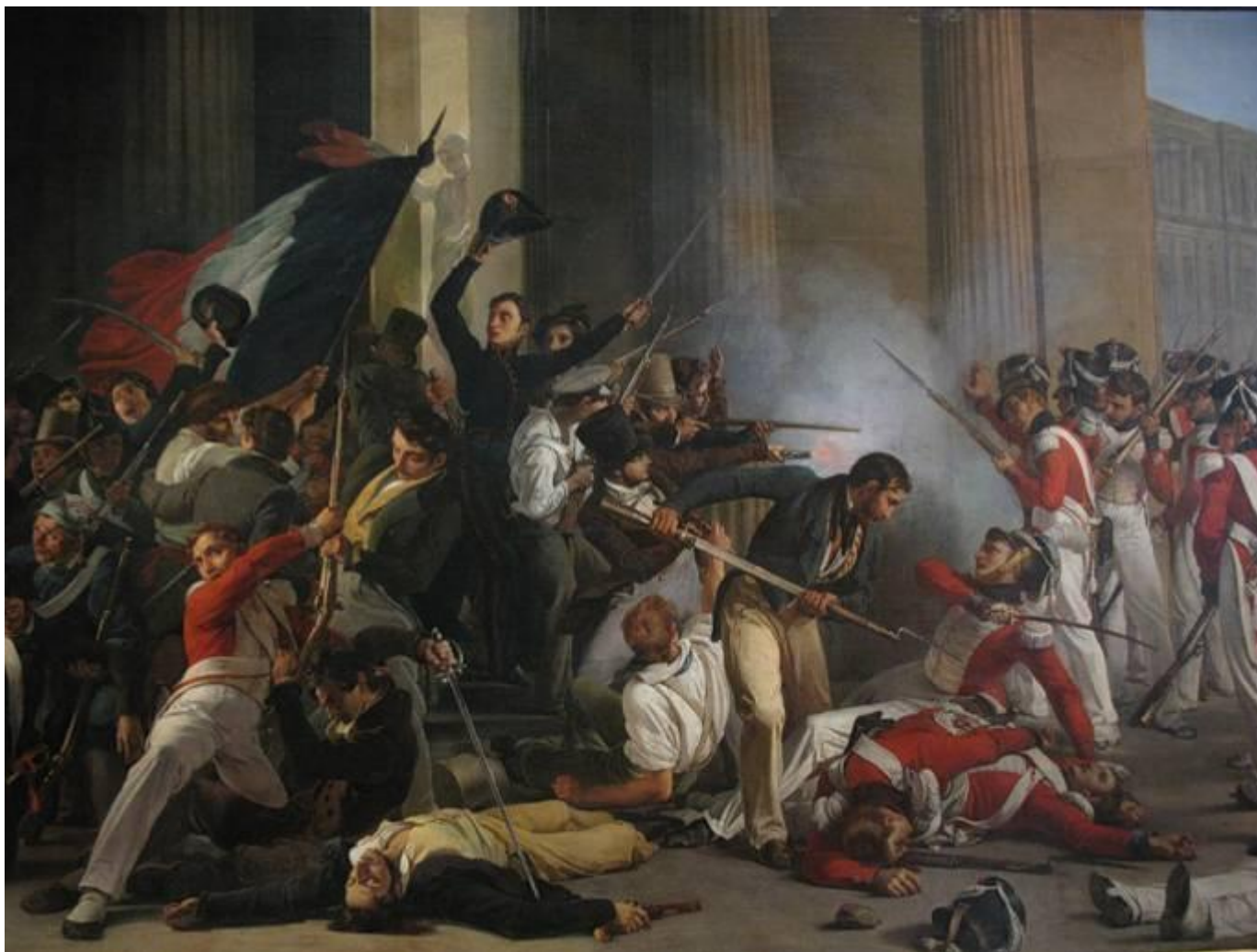
Штурм дворца Тюильри, 1830 г.