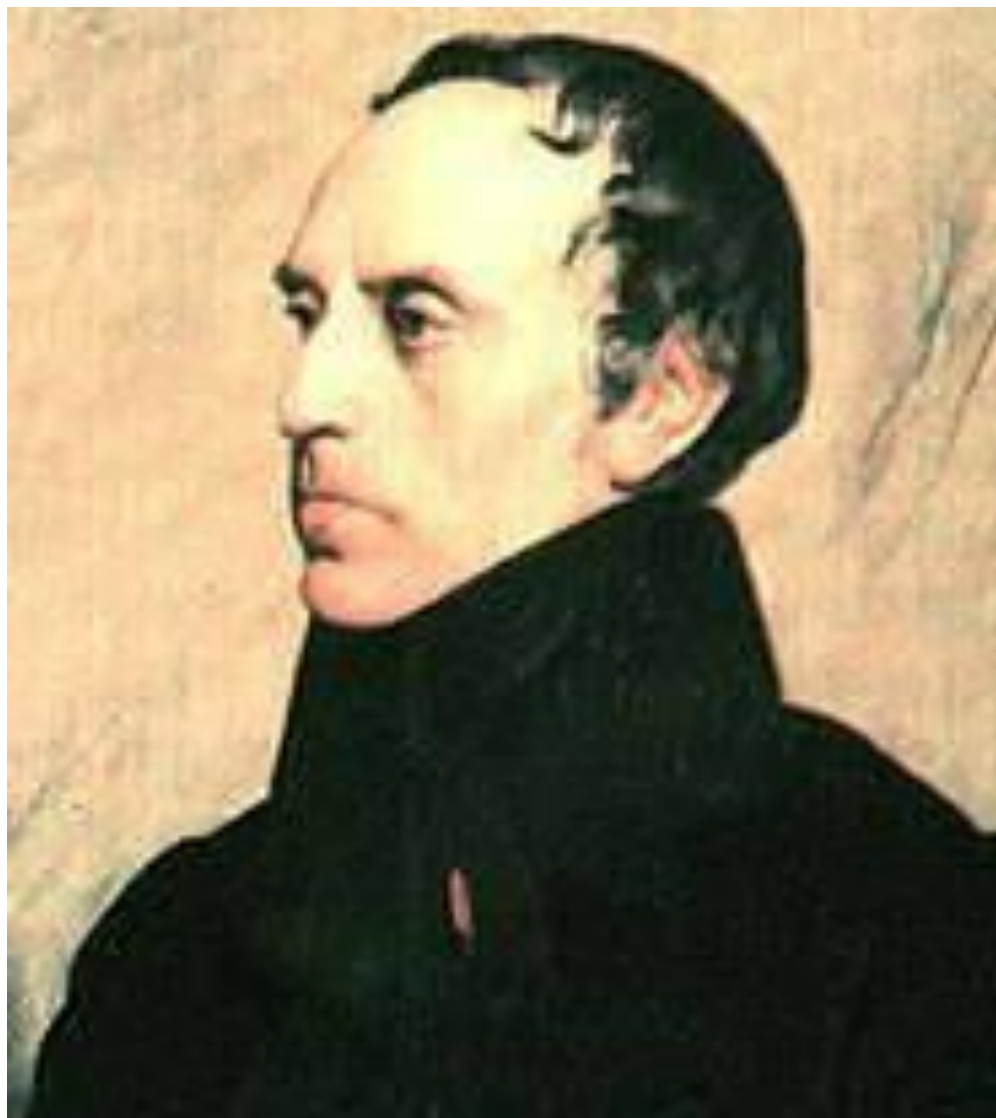
Премьер-министр Франсуа Гизо