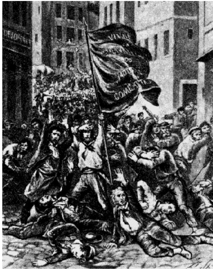
Восстание лионских ткачей, 1831 г.