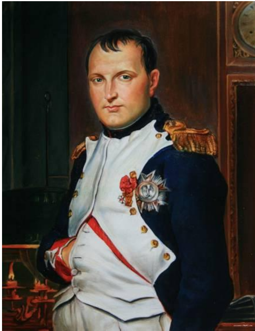
Император Наполеон Бонапарт