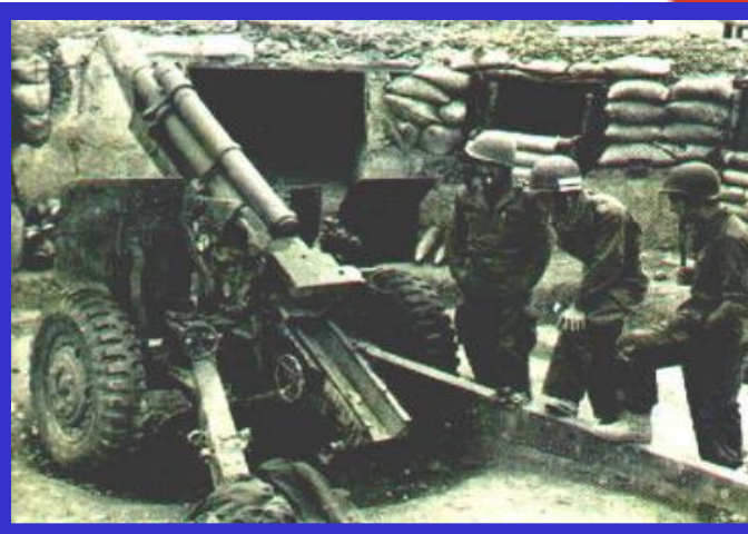
Французские солдаты в Индокитае

Согласно конституции французская колониальная империя преобразовалась во Французский Союз, в который включались и государства, вставшие уже на путь независимости. Среди них были Вьетнам, Камбоджа, Лаос. Но коммунистическое правительство Вьетнама отказалось признать это решение, что привело к войне Франции против Демократической Республики Вьетнам (1946-1954 гг.).