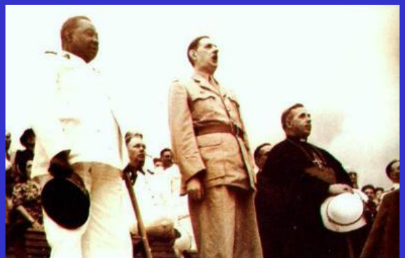
Генерал де Голль

Основные силы страны видели в Шарле де Голле сильную личность. В 1958 г. де Голль стал премьером и провел через референдум Конституцию, превращавшую Францию в президентскую республику. Последующий период вошёл в историю Франции под названием Пятой республики.