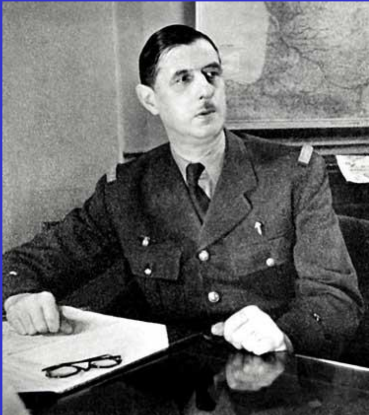
Шарль де Голль

После окончания Второй мировой войны Франция утратила положение великой державы. На фоне экономического упадка страна попала в зависимость от финансовой политики США. После войны распалась и французская колониальная система. Летом 1944 г. во Франции было образовано Временное правительство, которое возглавил Шарль де Голль. Оно начало подготовку к выборам Учредительного собрания. В стране был восстановлен демократический строй. К суду были привлечены люди, сотрудничавшие с гитлеровцами. В экономике страны были национализированы ряд отраслей промышленности.