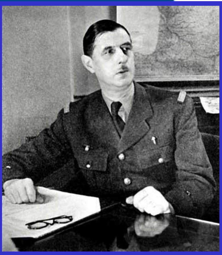
Шарль де Голль

После окончания Второй мировой войны Франция утратила положение вели-