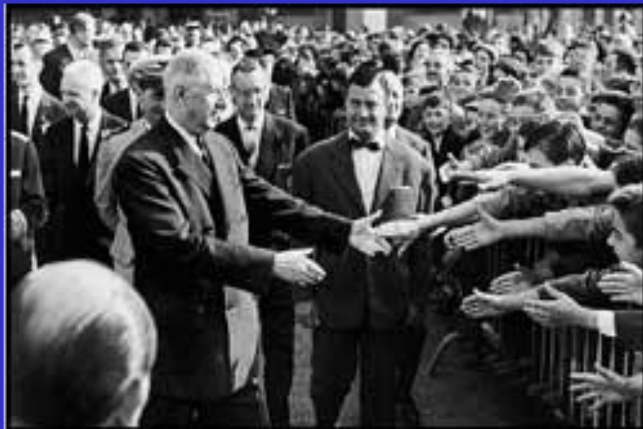
Французы приветствуют Шарля де Голля

В послевоенной Франции расставились с идеями фашизма и определяли Французская Коммунистическая партия (ФКП), Социалистическая партия (СФИО), Католическая партия и Народно-республиканское движение (МРП). В октябре 1945 г. состоялись выборы в Учредительное собрание, победу