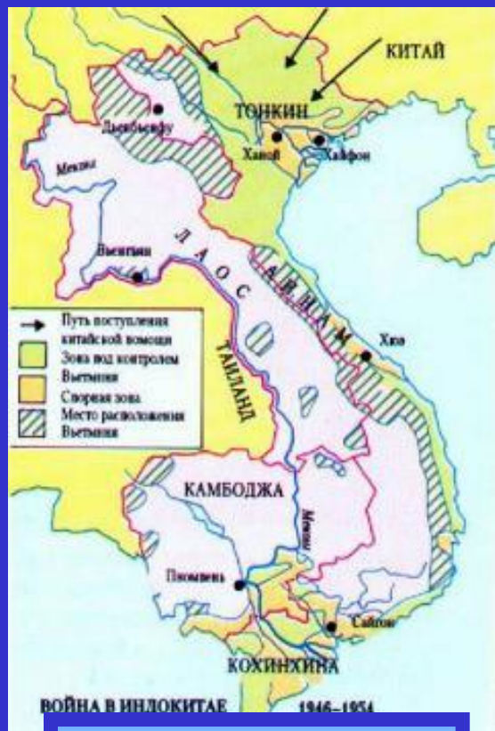
Война в Индокитае