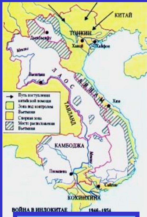
Война в Индокитае