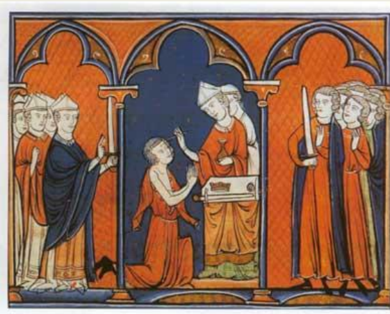
Помазание на царство. Людовик IV.