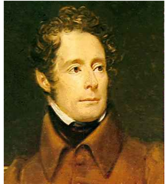
Альфонс Ламартин — глава правительства