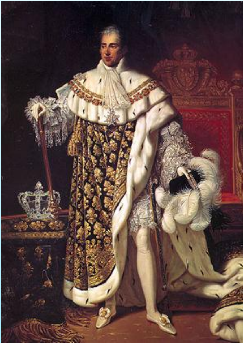
Карл X (1824-1830)