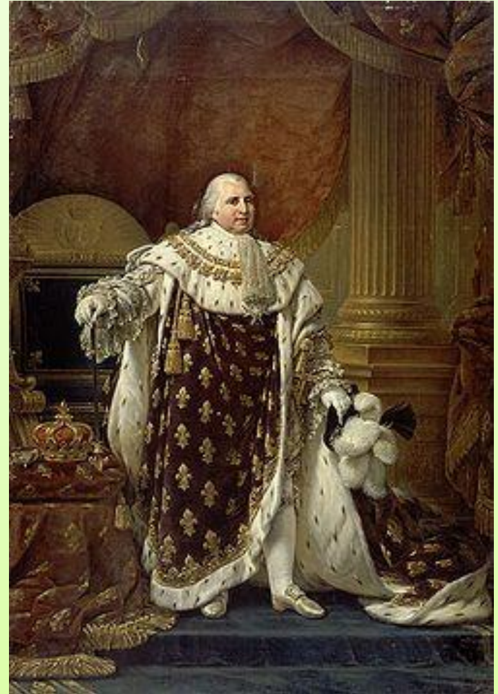
Людовик XVIII (1815-1824)