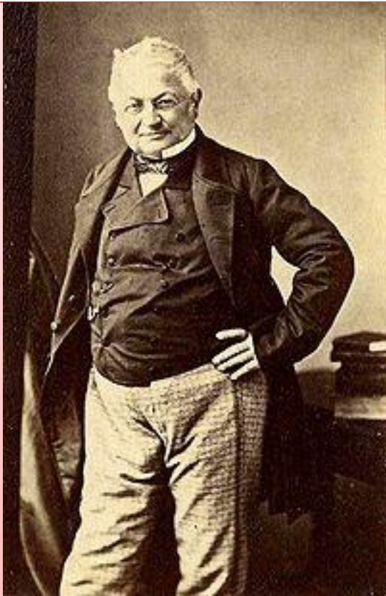
Луи Адольф Тьер