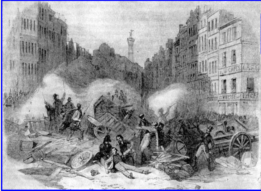
Баррикадные бои в Париже