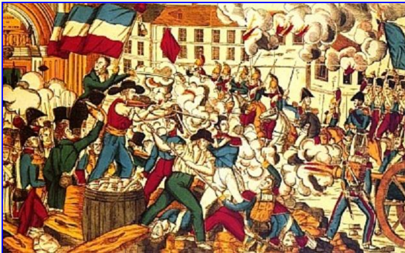
Восстание лионских ткачей

В 1830-е гг. возросло число стачек, иногда они перерастали в волнения и восстания. Крупные восстания рабочих-ткачей происходили в Лионе в 1831 и 1834 гг. Восстания жестоко подавлялись с помощью армии. В апреле 1834 г. волнения начались в Париже.