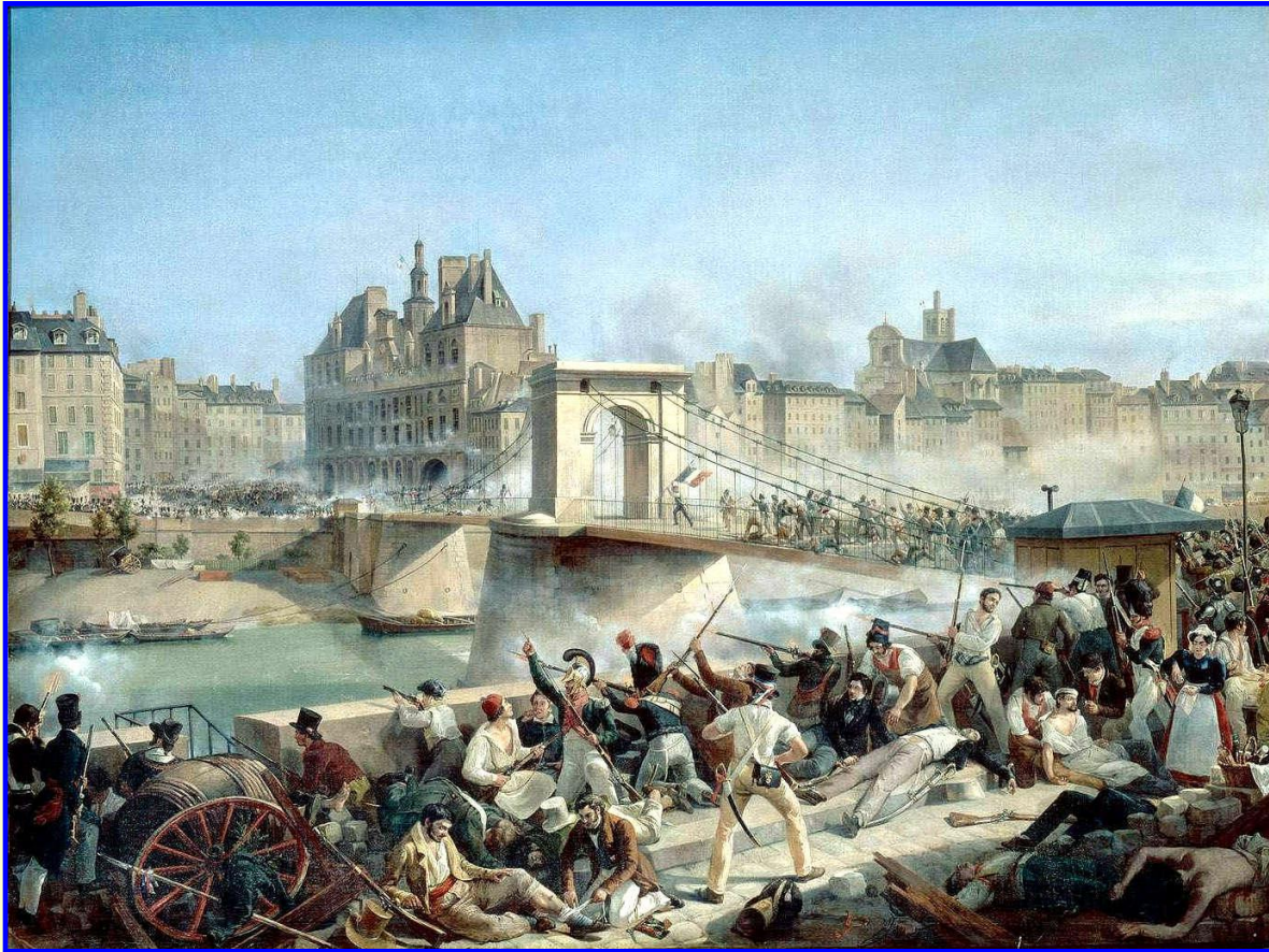
Уличные бои в Париже

В Париже начались демонстрации протеста, которые 27-29 июля 1830 г. переросли в ожесточенные уличные бои. Восставшие захватили городскую ратушу и королевский дворец Тюильри. Карл X с семьей бежал в Англию.