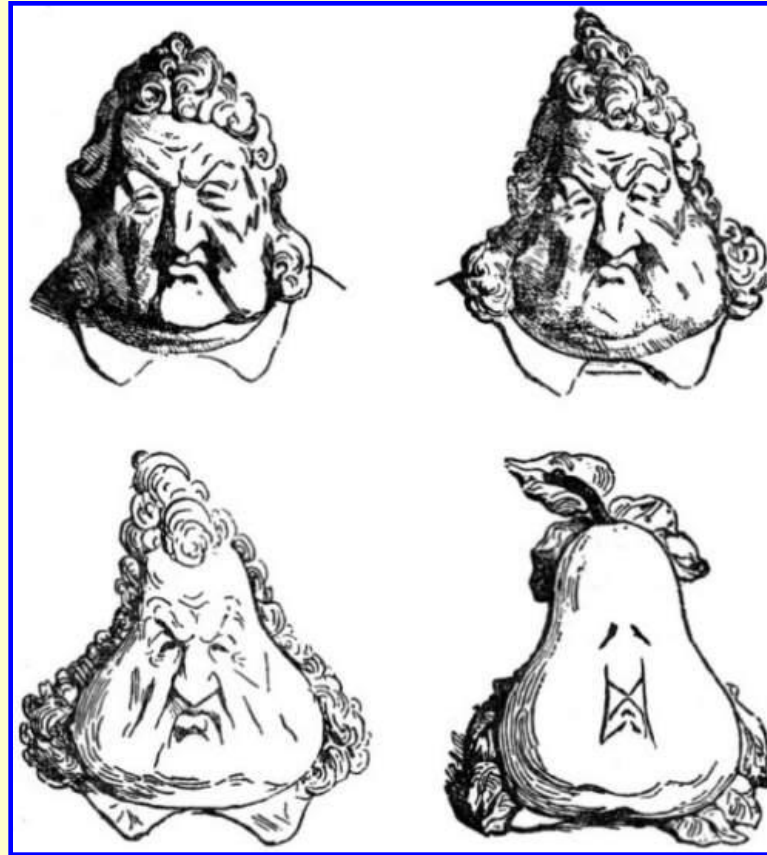
Карикатура на Луи Филиппа «Король- груша»

Подъем экономики не повлиял на тяжелую жизнь рабочих. Многие промышленники были недовольны правлением Луи Филиппа, т.к. он поддерживал финансовую буржуазию. В стране (в основном в Париже) стали возникать тайные республиканские общества.