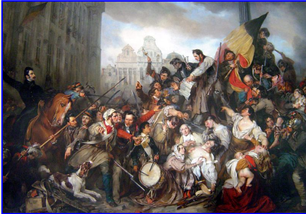
Восстание в Бельгии

С приходом к власти Луи Филиппа в стране окончательно утвердились капиталистические отношения. По поправкам в конституцию 1830 г. были снижены выборные цензы и число избирателей выросло почти в 2 раза (до 250 тыс.чел). Отголоски июльской революции прокатились по всей Европе: восстание против власти голландцев в Бельгии, восстания в Италии и Польше.