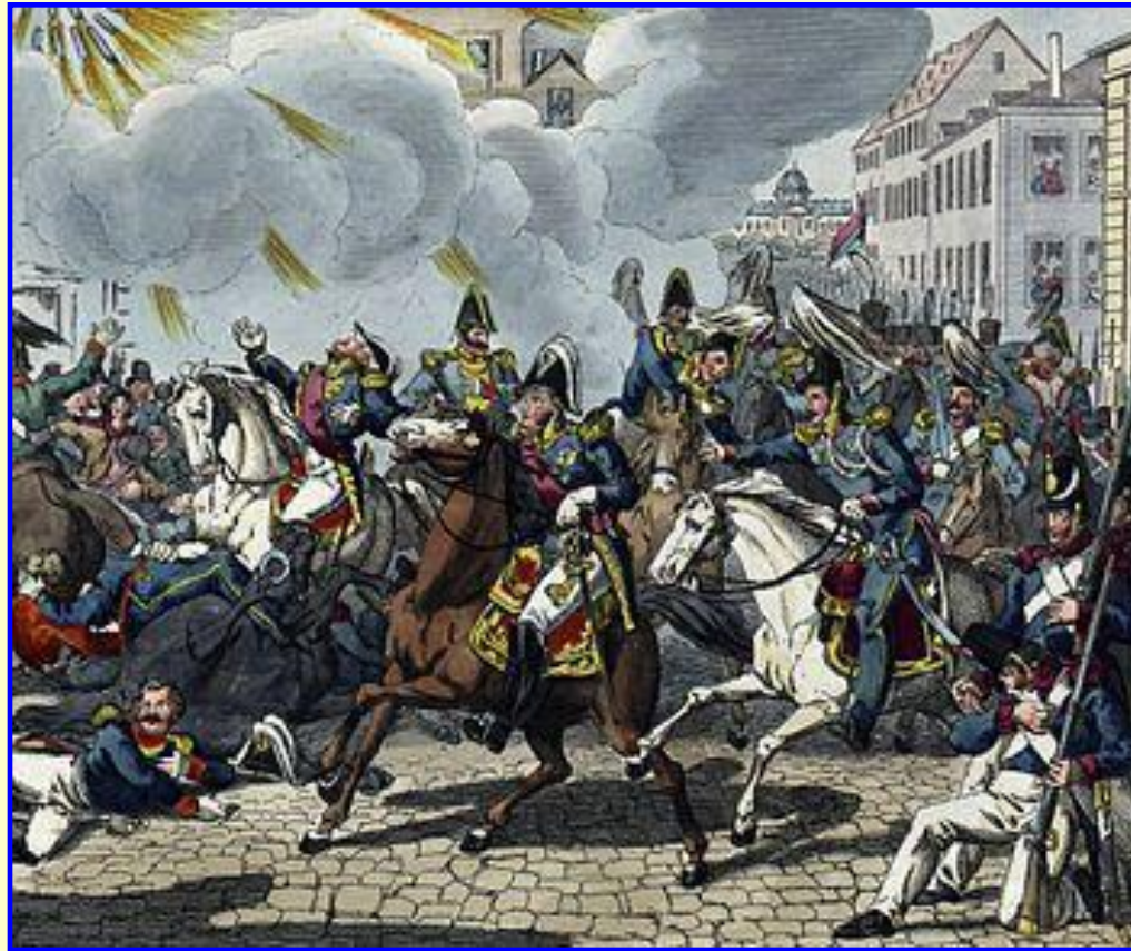
Покушение на Луи Филиппа

К середине 1840-х гг. во Франции начался социальный и экономический кризис. Безработных становилось все больше, росли цены, в 1845-1847 страну постигли неурожай. Авторитет «народного короля» падал. На него было совершено более 10 покушений.