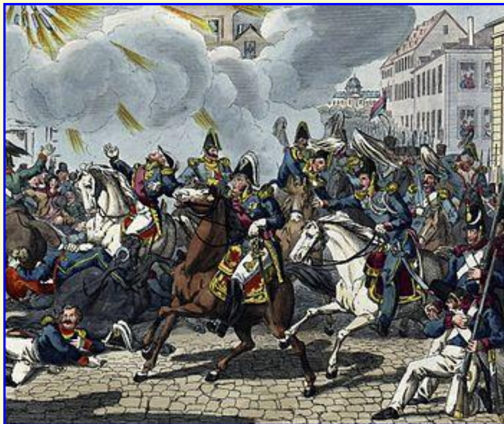
Покушение на Луи Филиппа

К середине 1840-х гг. во Франции начался социальный и экономический кризис. Безработных становилось все больше, росли цены, в 1845-1847 страну постигли неурожай. Авторитет «народного короля» падал. На него было совершено более 10 покушений.