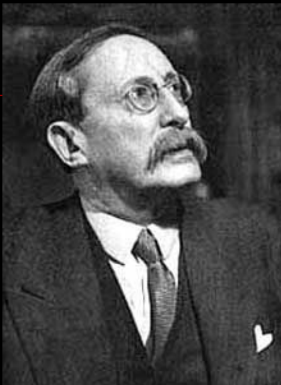
ЛЕОН БЛЮМ - ПРЕМЬЕР-МИНИСТР ФРАНЦИИ.