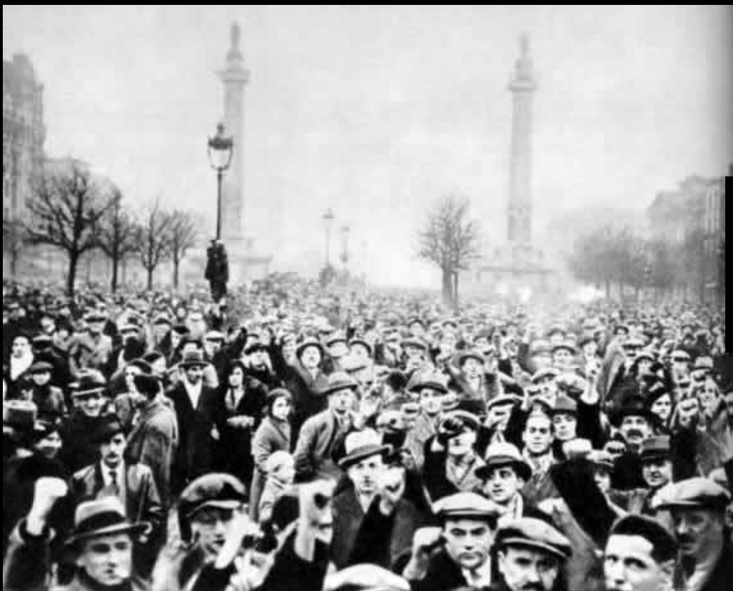
Демонстрация французского пролетариата против попытки фашистского переворота. Париж. 1934 г.