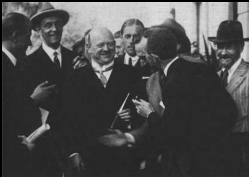
Министр иностранных дел Германии Густав Штресеман с журналистами. Локарно. Швейцария. 16 октября 1924 года.