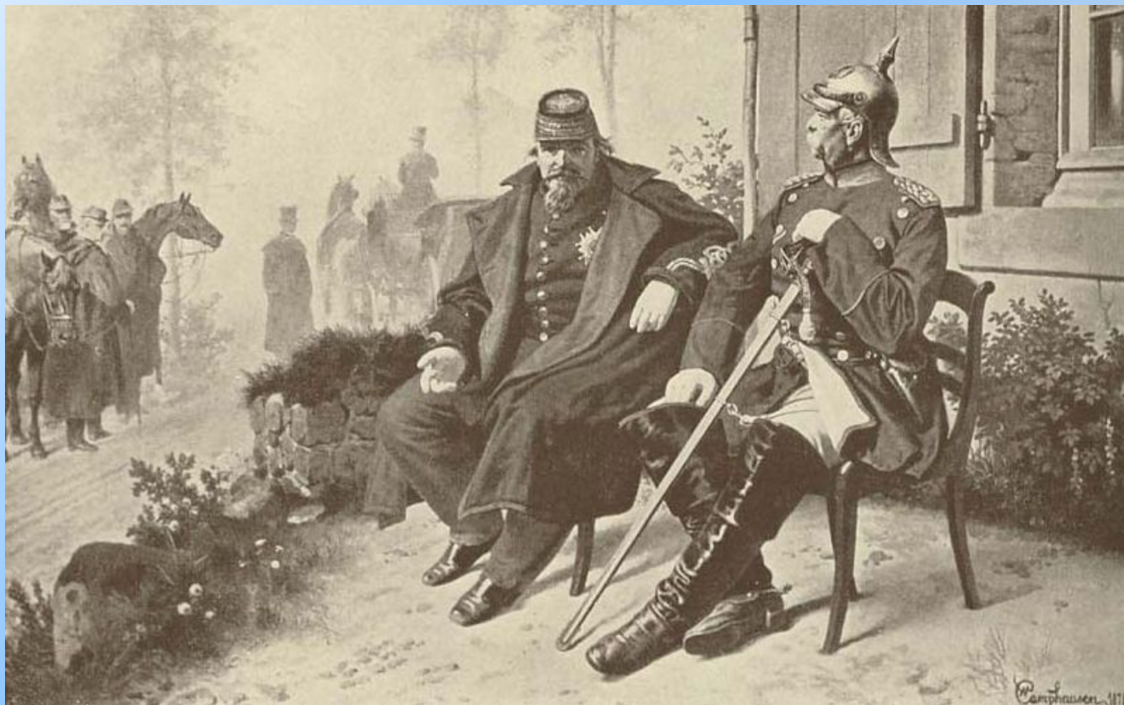
Наполеон III в плену у Бисмарка в 1870