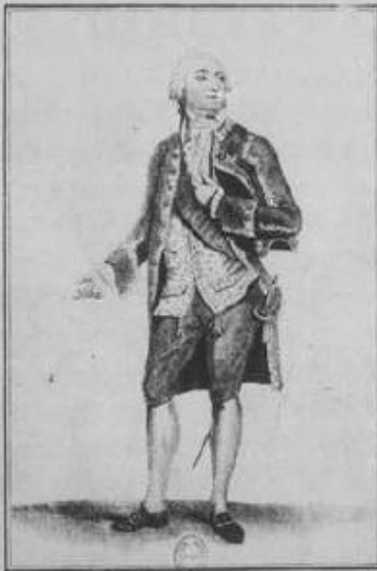
Je suis Citoyen