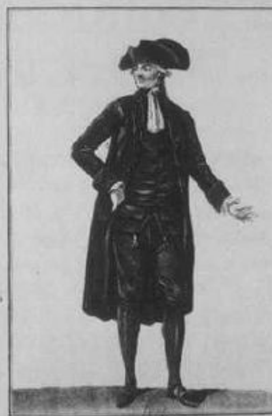
Je suis Député de l'Etat

Вспомните и расскажите, опираясь на рисунки XVIII века и имеющиеся у вас знания о сословиях Франции.