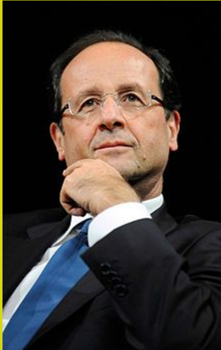
Президент Франції Франсуа Олланд (з 2012 р.)