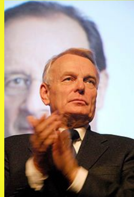
Від 15 травня 2012 року уряд Франції очолює Жан-Марк Еро.