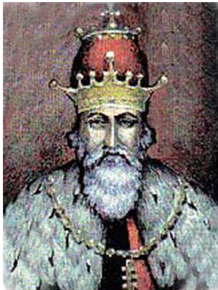
Даниил Романович Галицкий (1204—1264)