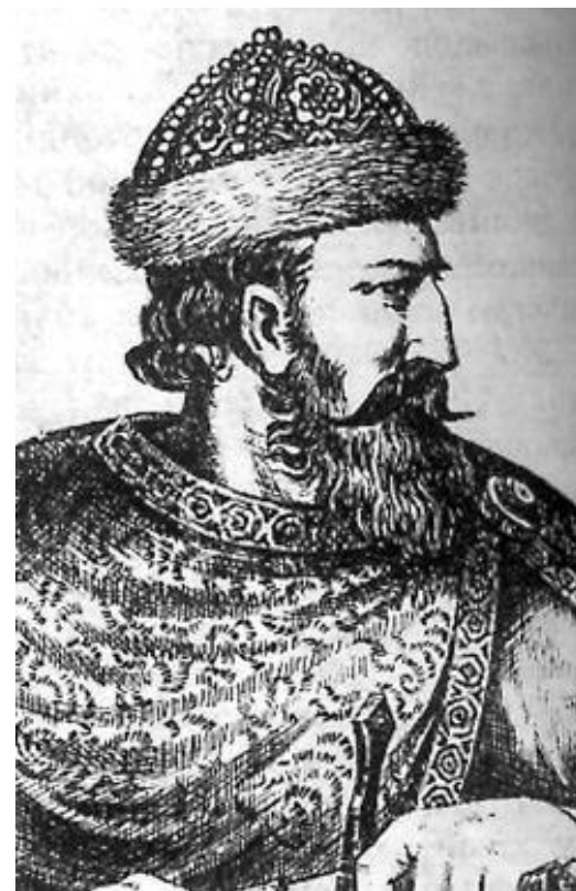
Роман Мстиславович Волынский (1150—1205гг.)