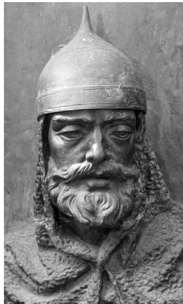
Мстислав Мстиславич Удатный (1176—1228)