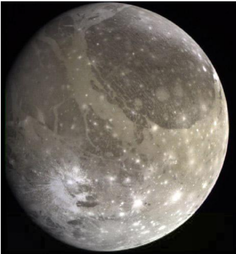
Ганимед. Спутник Юпитера.

В честь Ганимеда названы спутник Юпитера Ганимед, открытый в 1610 году Галилео Галилеем и астероид (1036) Ганимед, открытый в 1924 году немецким астрономом Валтером Бааде.