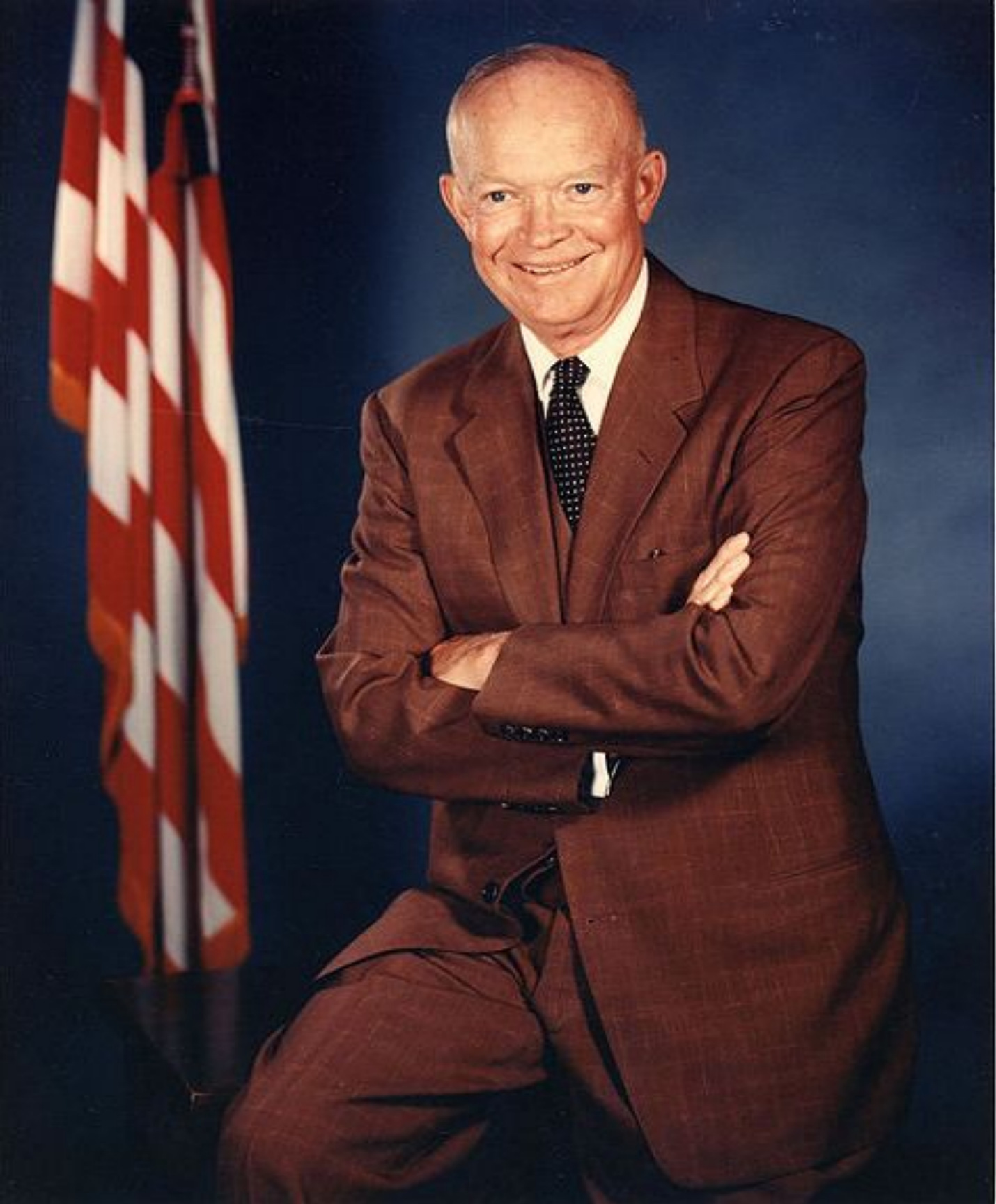
Дуайт Дэвид Эйзенхауэр (1953-1961)