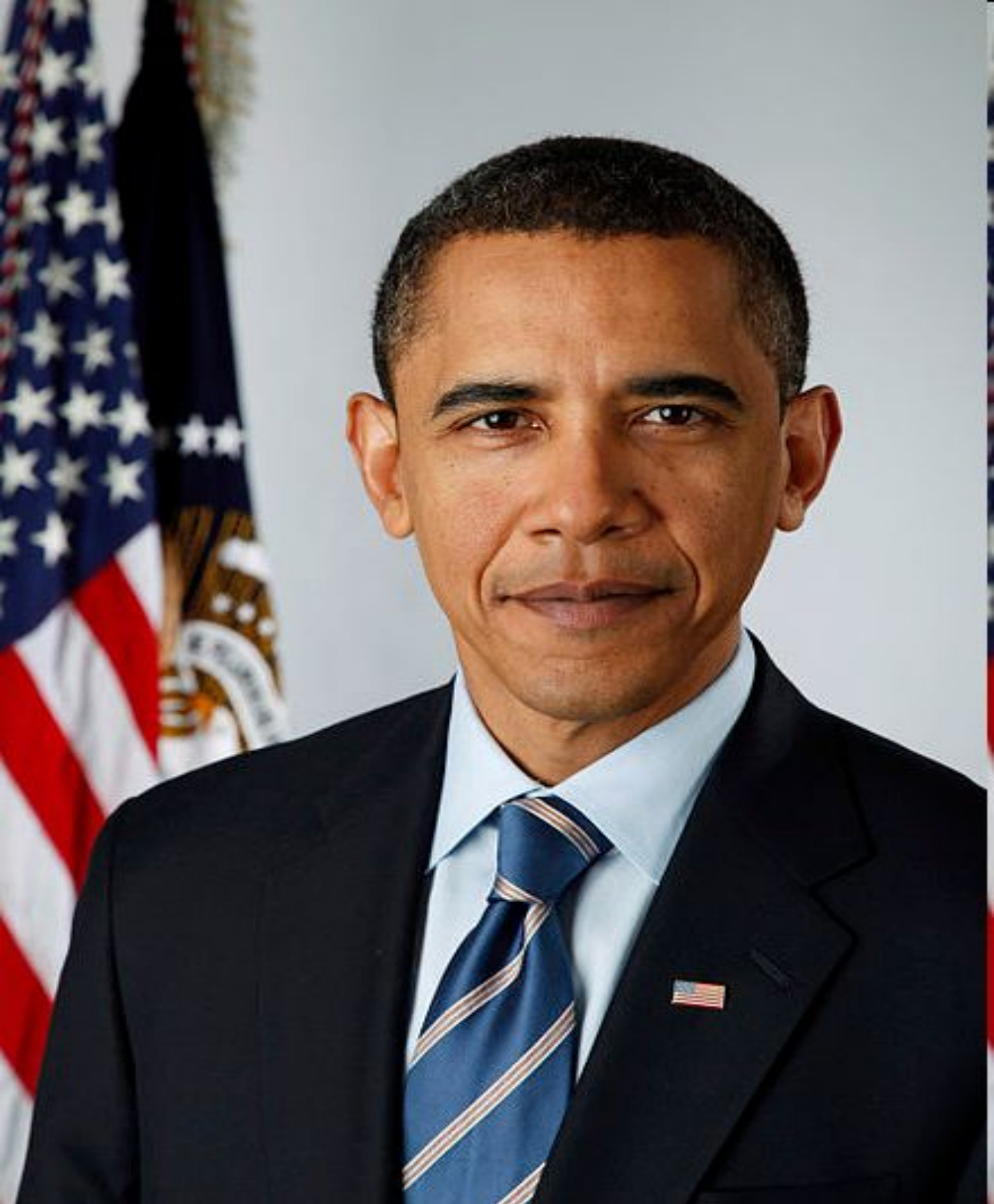
Барак Хуссейн Обама II ( с 2009 г.) 44-ый президент