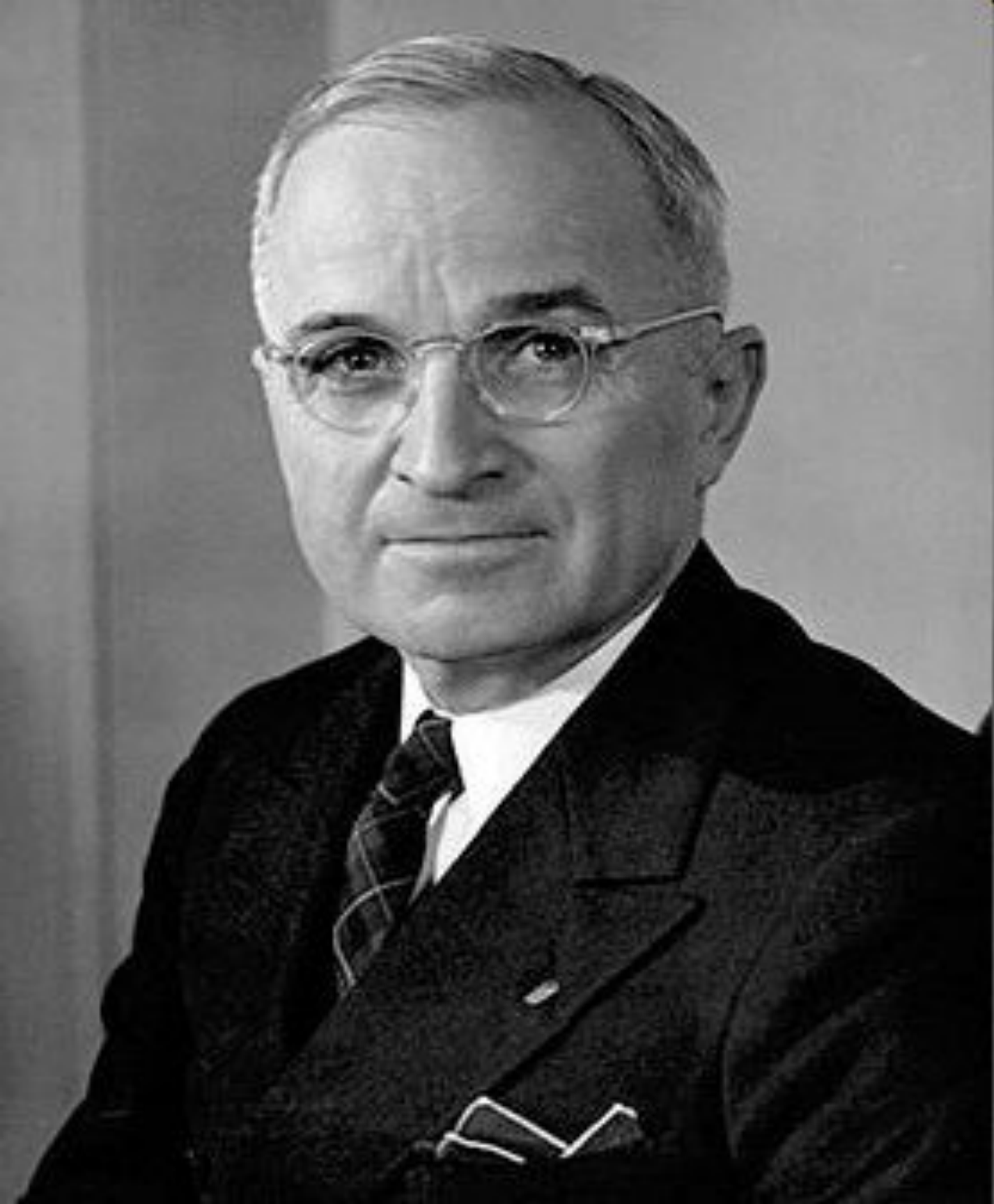
Гарри Трумэн (1945 – 1953)