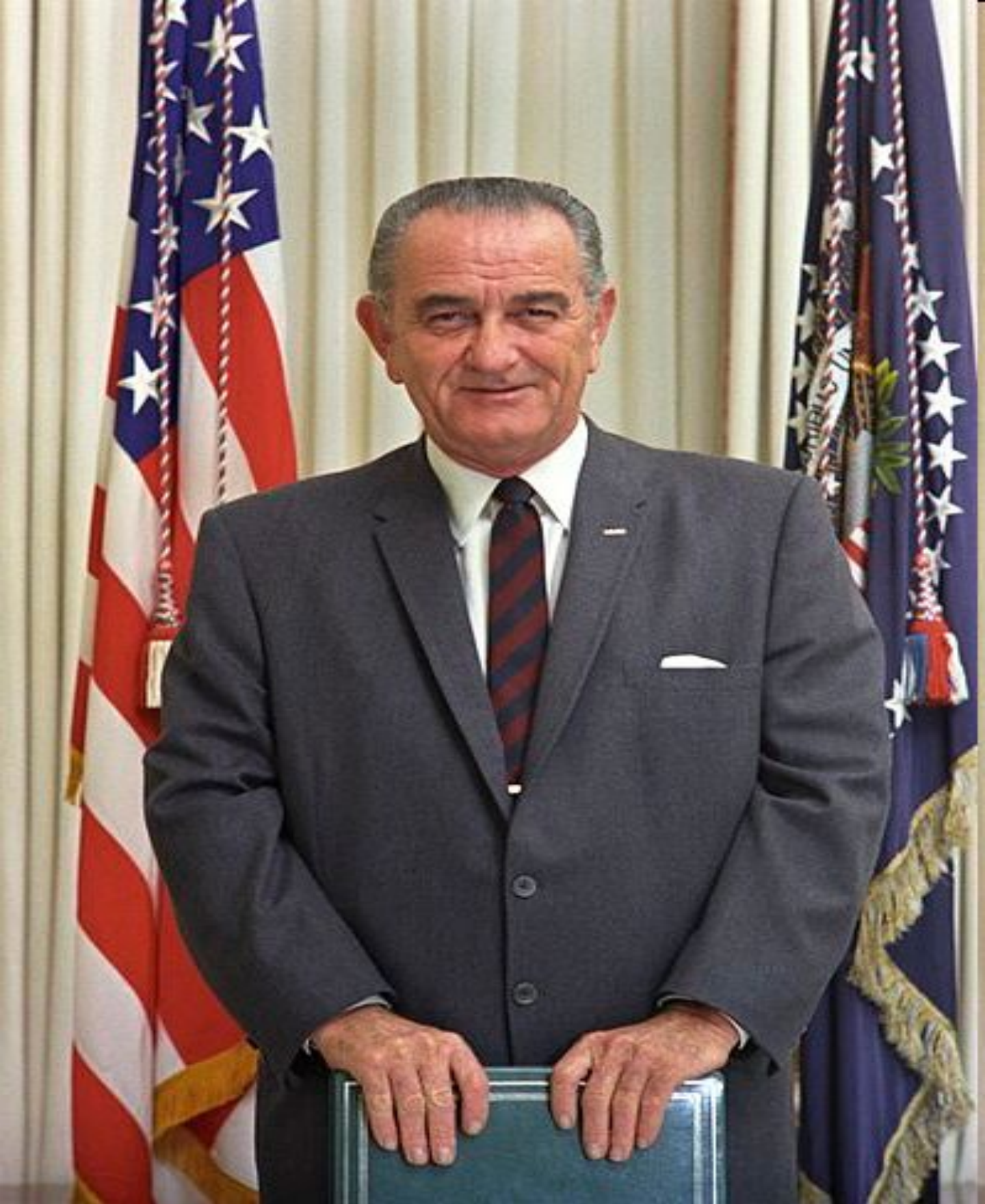
Линдон Бэйнс Джонсон (1963-1968)