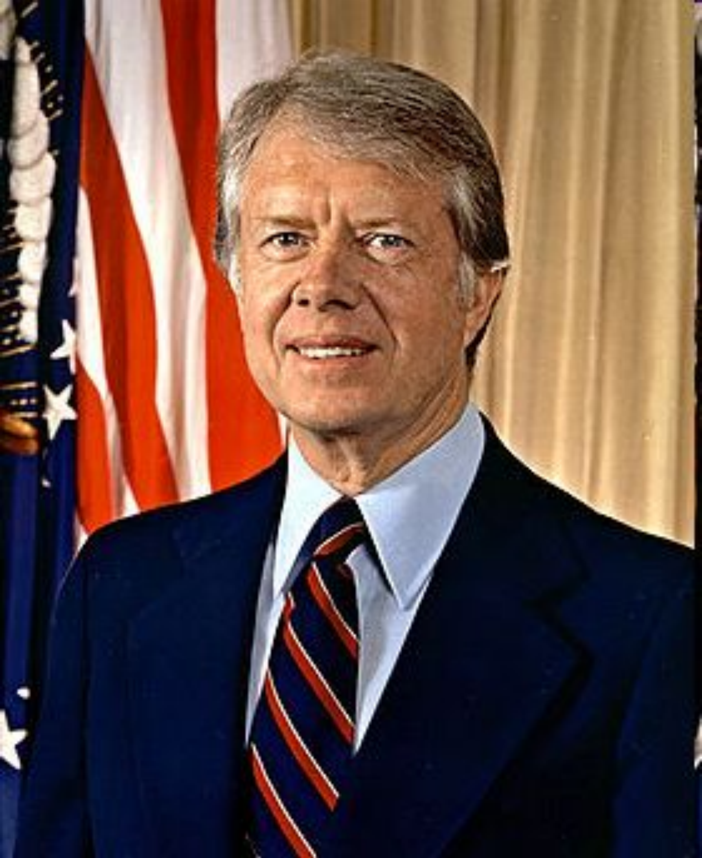
Джеймс Эрл Картер (1977-1981)