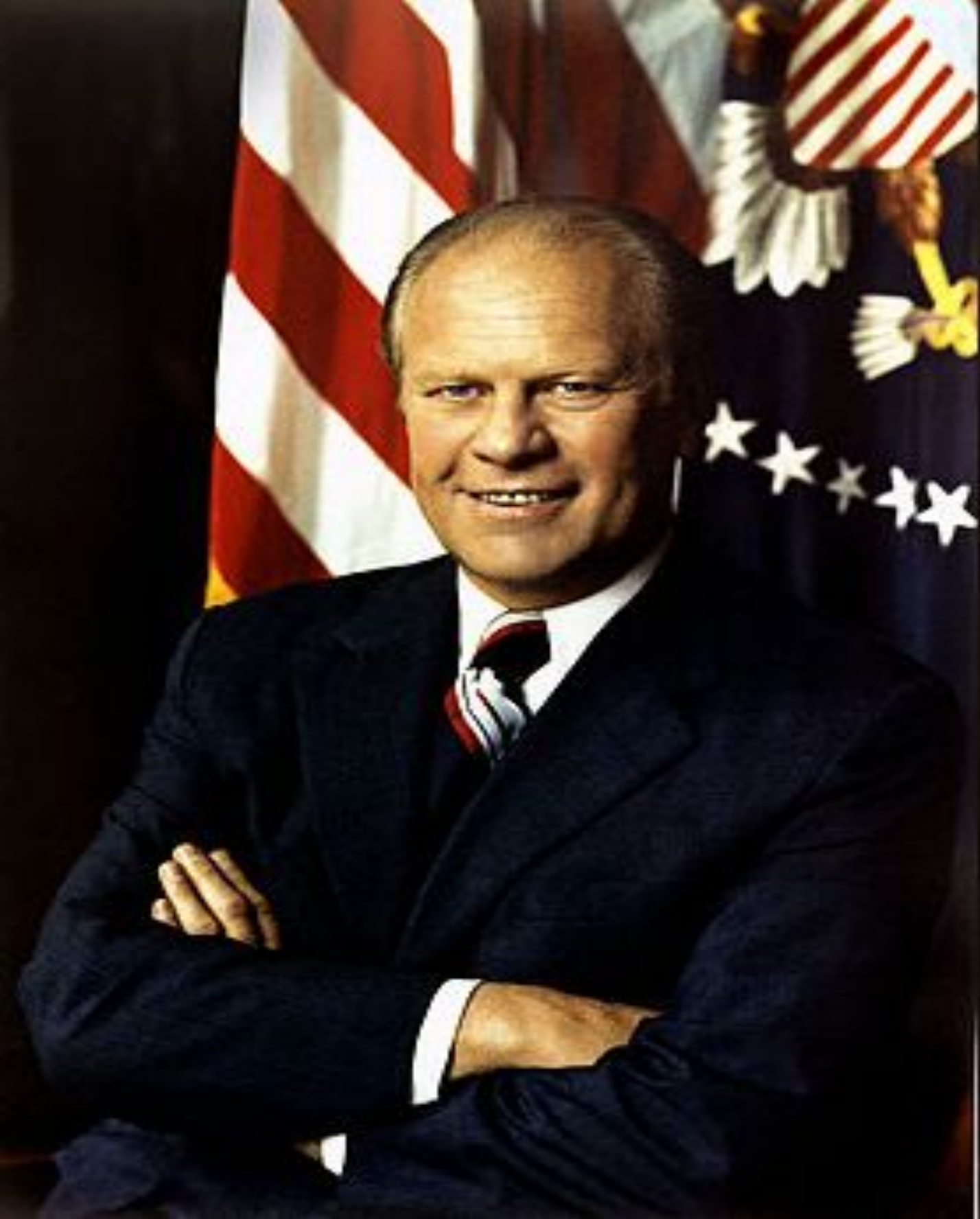
Джералд Рудолф Форд (1974-1977)