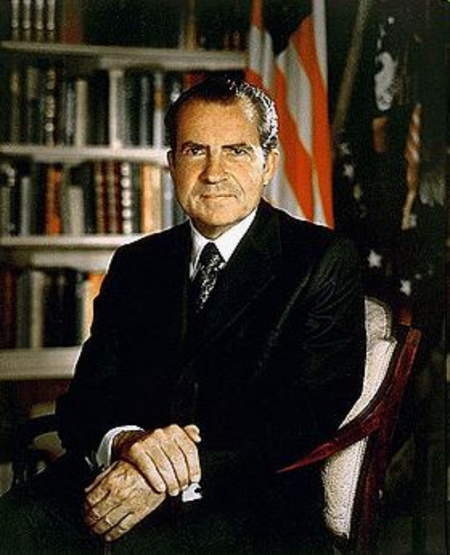
Ричард Милхауз Никсон (1968-1974)