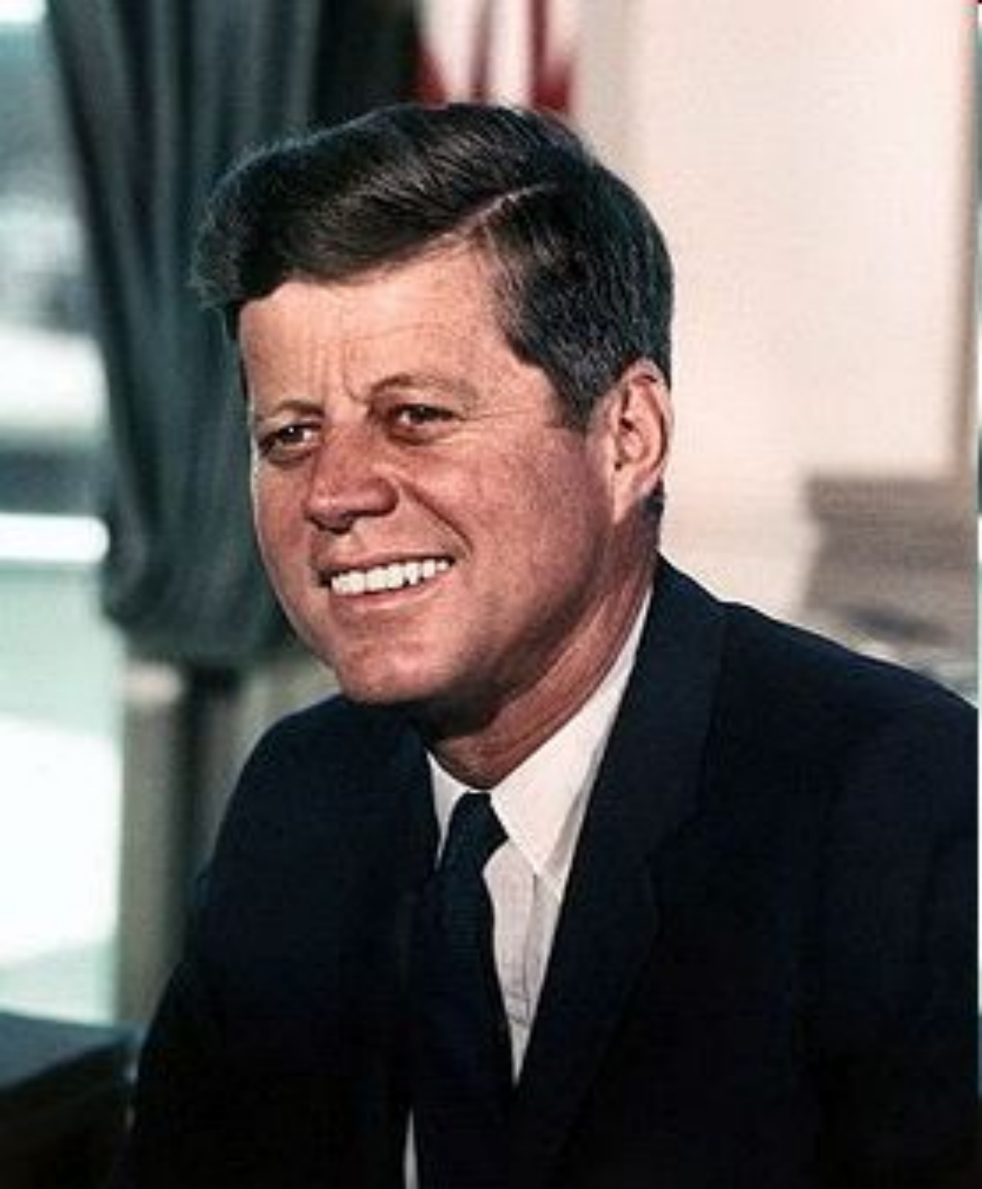
Джон Фицджеральд Кеннеди (1961-1963)