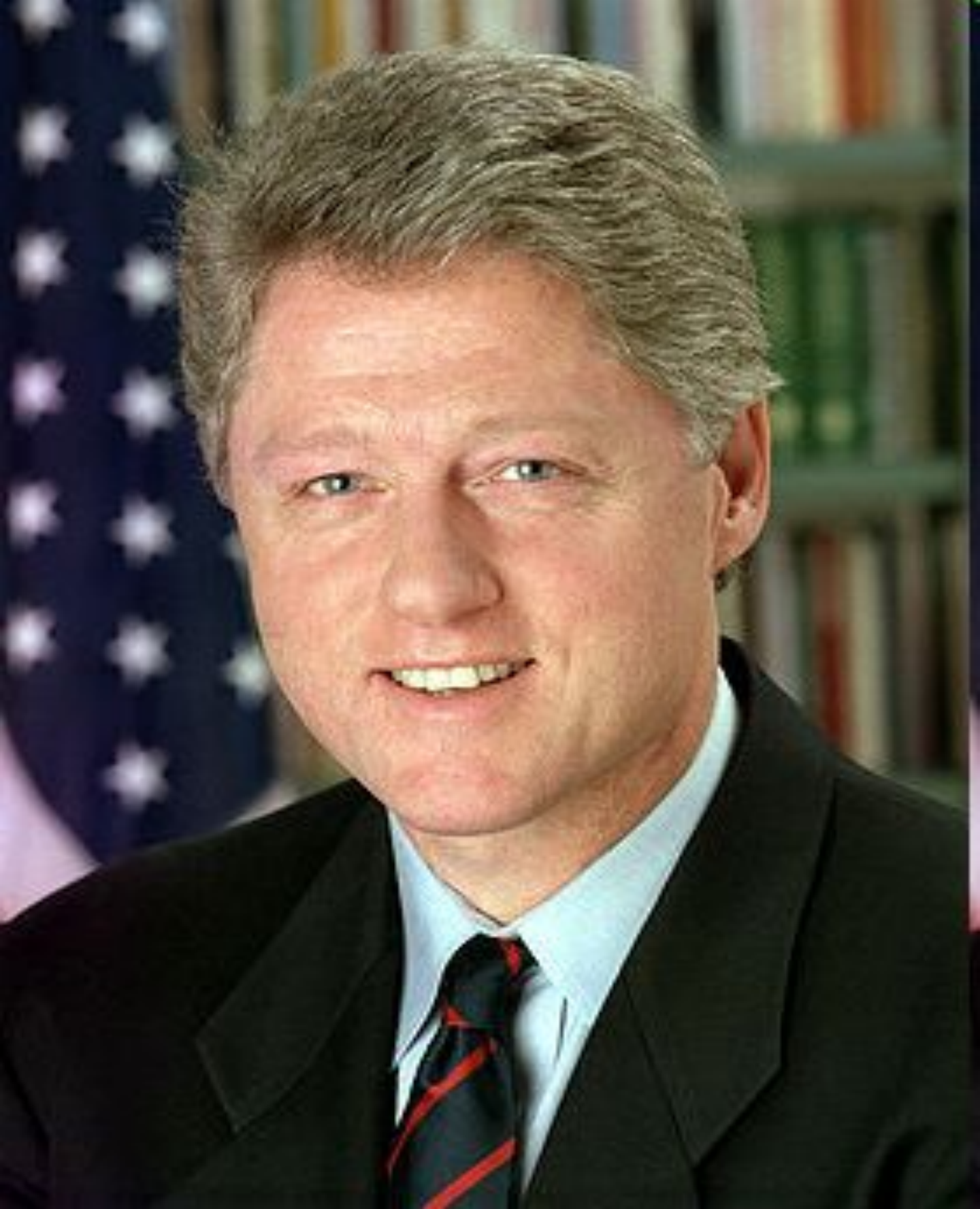
Уильям Джефферсон Клинтон (1993-2001)