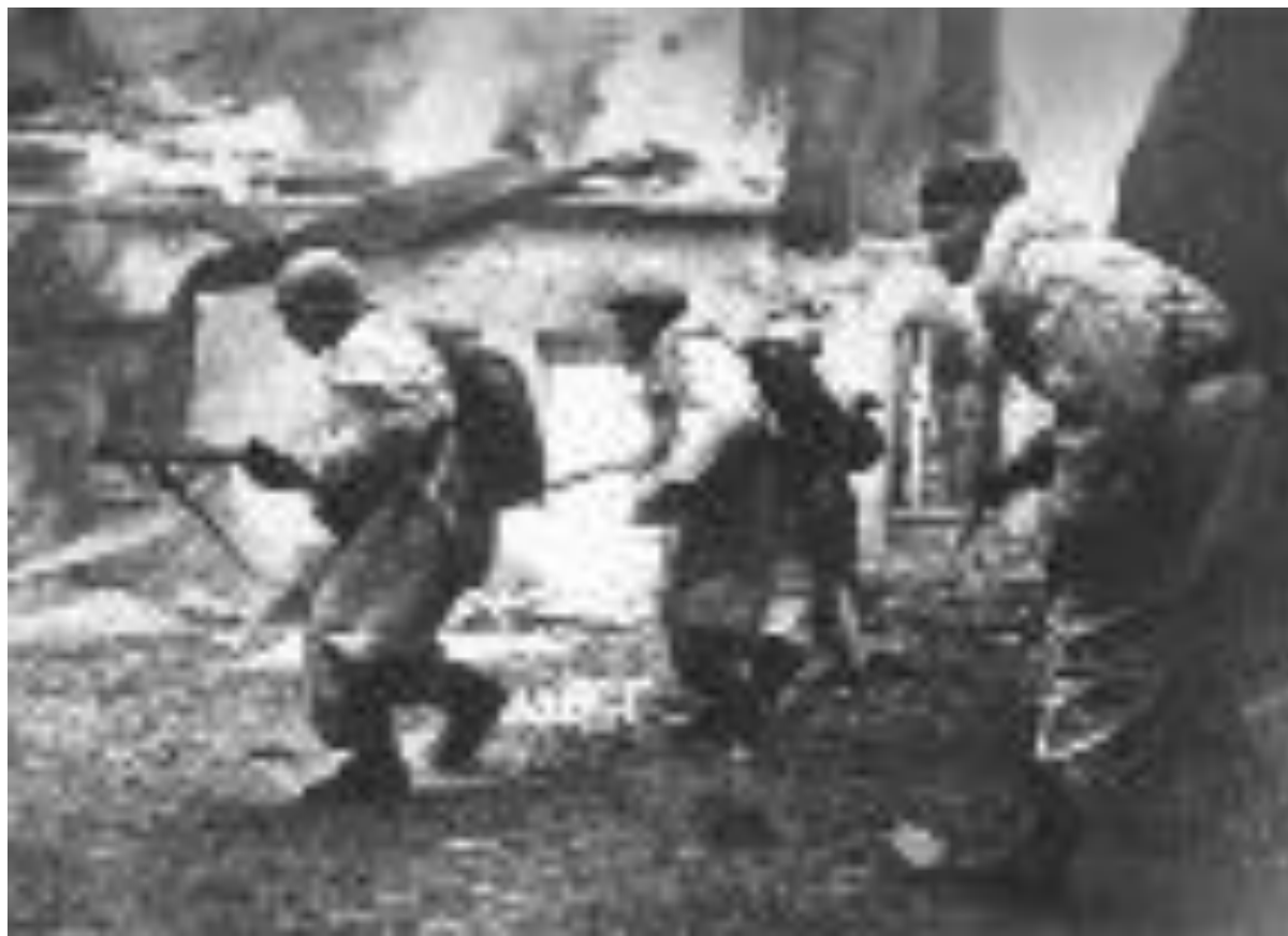
Воины Ленинградского фронта ведут бой в Гатчине

В годы Великой Отечественной войны город был оккупирован немецкими войсками. Дворцово-парковый ансамбль Гатчины был почти полностью разрушен.