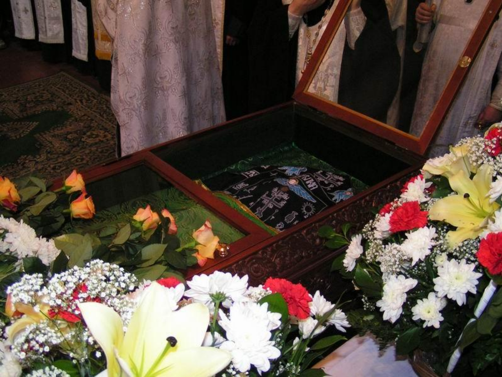
Гатчина. Мощи св. Марии Гатчинской