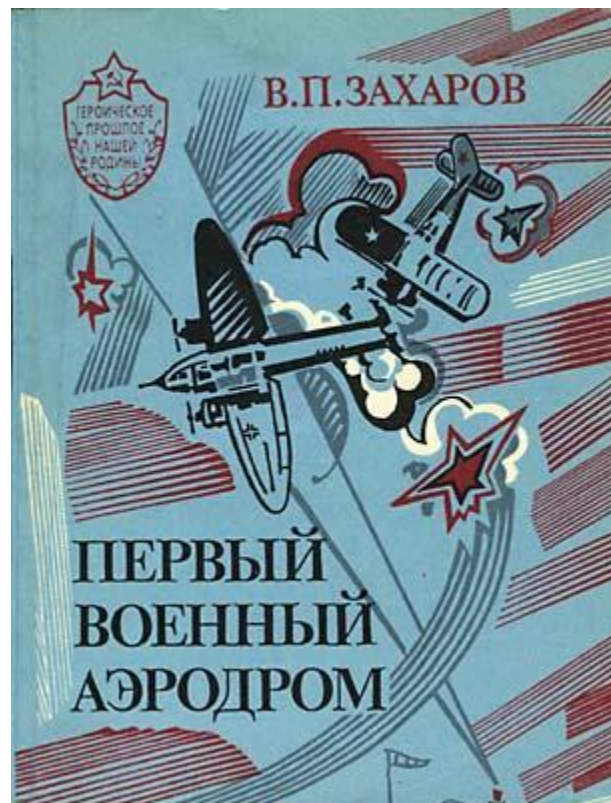
Гатчина (1915 - 1933 гг.). Исторические фотографии "На заре авиации"