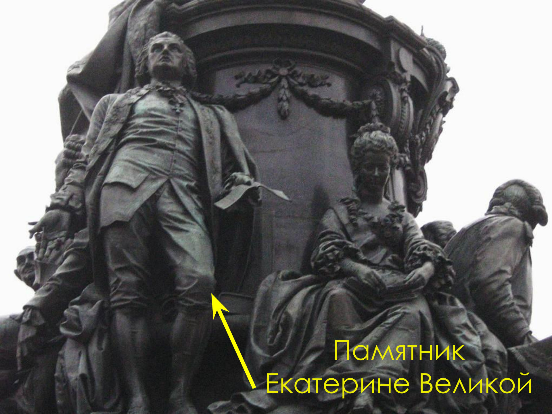
Памятник Екатерине Великой