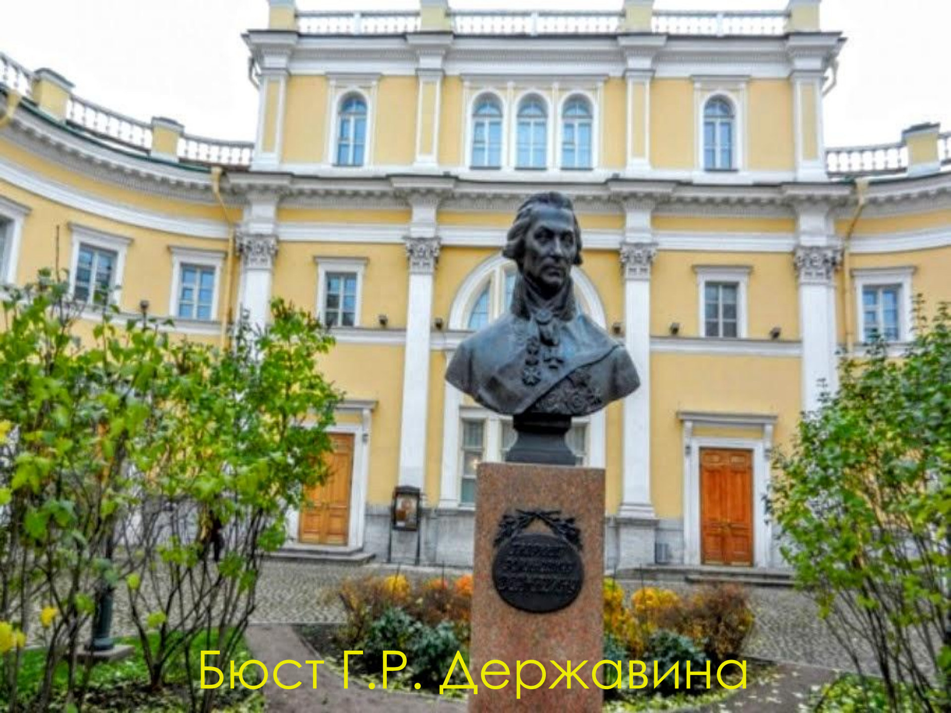
Бюст Г.Р. Державина