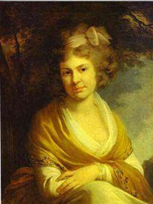
Дочь Суворова Наталья в 20 лет.