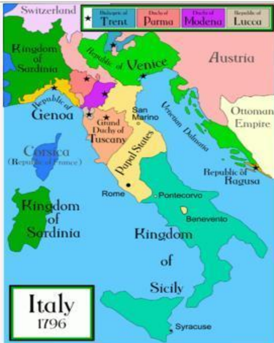
Республика Генуя на карте Италии в 1796 году

Генуэзская республика Repubblica di Genova