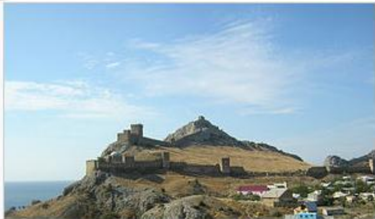
Башни Генуэзской крепости в Судакe, возведённой между XIV и XV веком