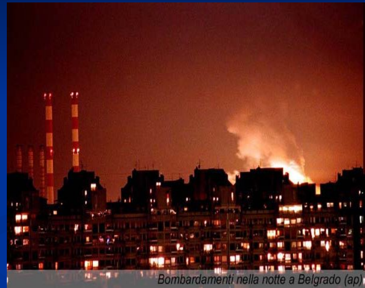
Bombardamenti nella notte a Belgrado

Руководство России осудило эти действия как агрессию и потребовало созыва Совета Безопасности ООН. Были прерваны отношения России с НАТО.