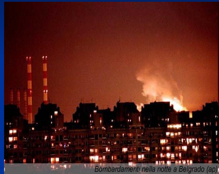
Bombardamenti nella notte a Belgrado

Руководство России осудило эти действия как агрессию и потребовало созыва Совета Безопасности ООН. Были прерваны отношения России с НАТО.