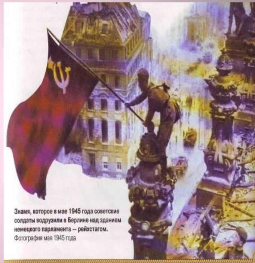
Знамя, которое в мае 1945 года советские солдаты водрузили в Берлине над зданием немецкого парламента – рейхстагом. Фотография мая 1945 года