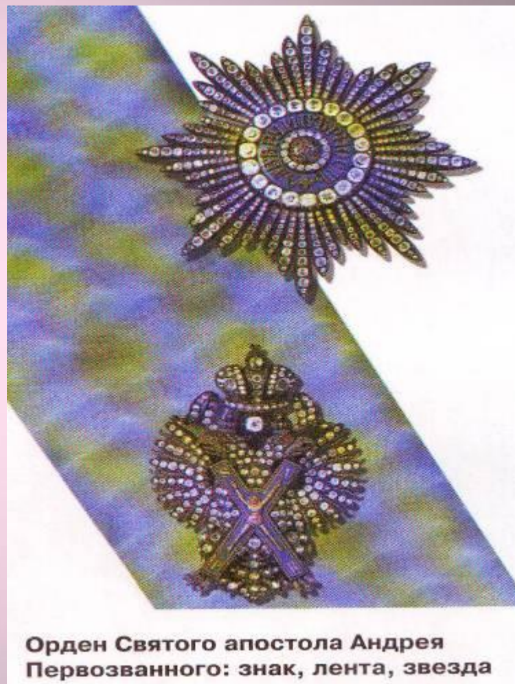
Орден Святого апостола Андрея Первозванного: знак, лента, звезда