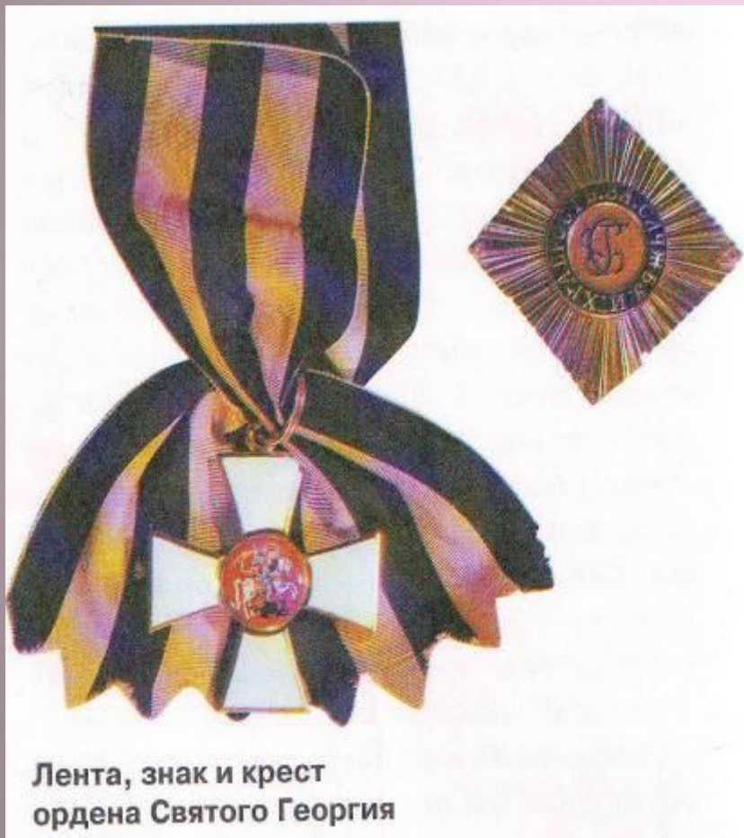
Лента, знак и крест ордена Святого Георгия