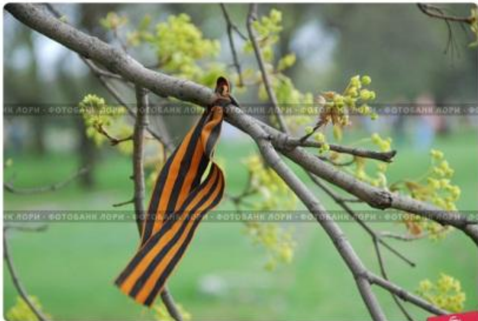
Георгиевская лента на дереве, развевающаяся на ветру. На Пискаревском в День