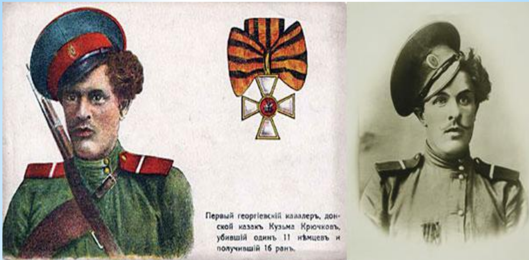
Первый георгиевский кавалер, донской казак Кузьма Крючков, убивший один 11 немцев и получивший 16 рань.

Первый георгиевский кавалер, донской казак Кузьма Крючков, убивший один 11 немцев и получивший 16 ран, во время Первой Мировой войны (1914-1918гг.)