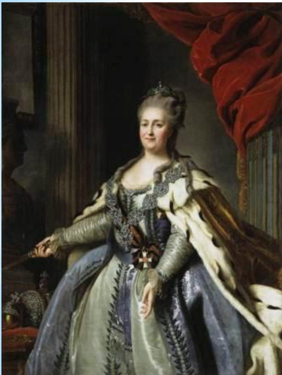
Екатерина II с орденом Святого Великомученика и Победоносца Георгия