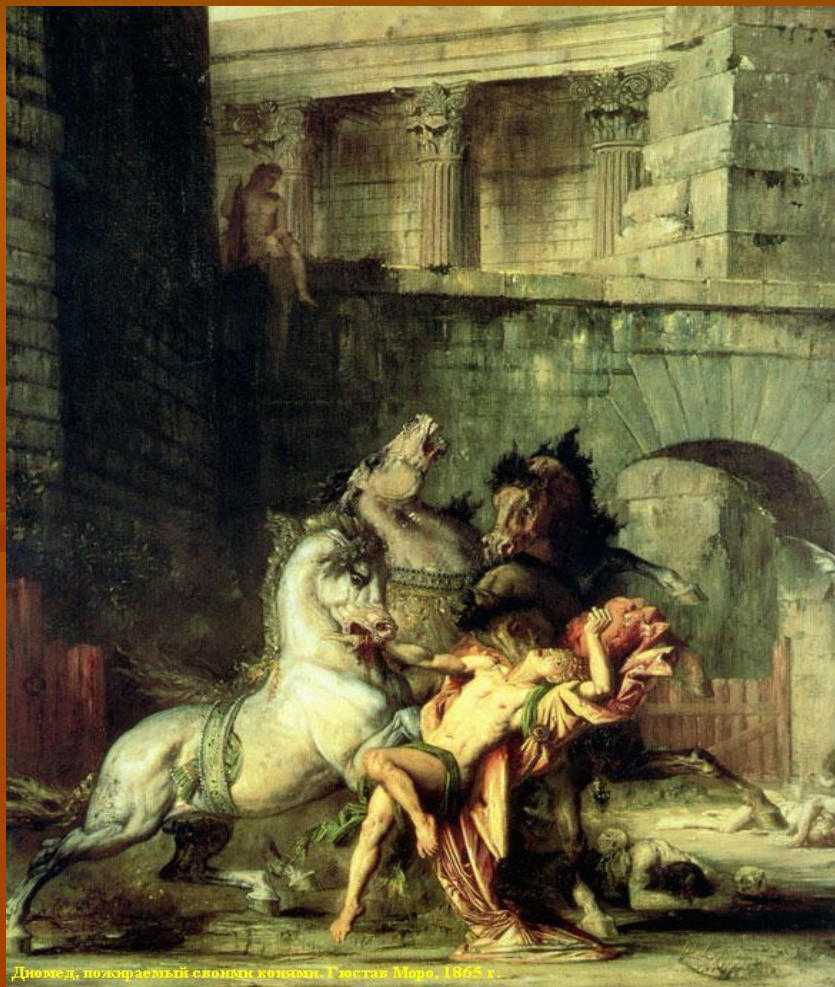
Диомед, пожираемый своими кобылами. Гюстав Моро, 1865 г.