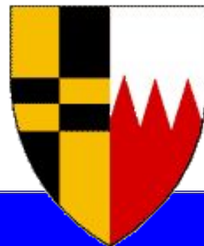
Герб замужней женщины