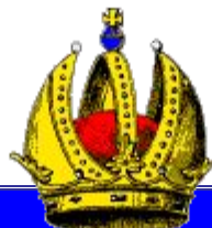
Германская императорская корона