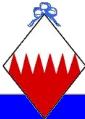
Герб незамужней женщины