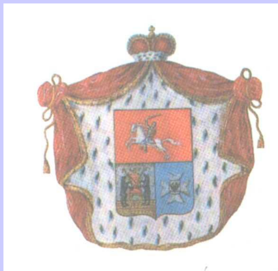
Герб рода Голицыных