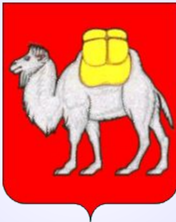
Герб Челябинской области