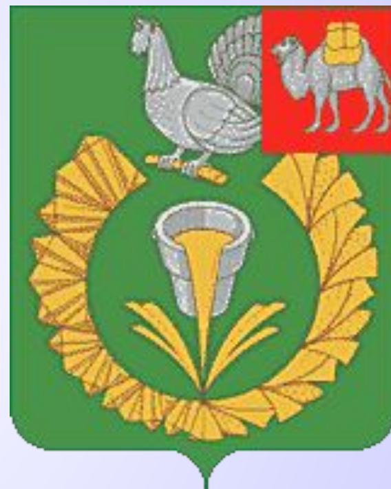
Современный герб г. Верхнего Уфалея