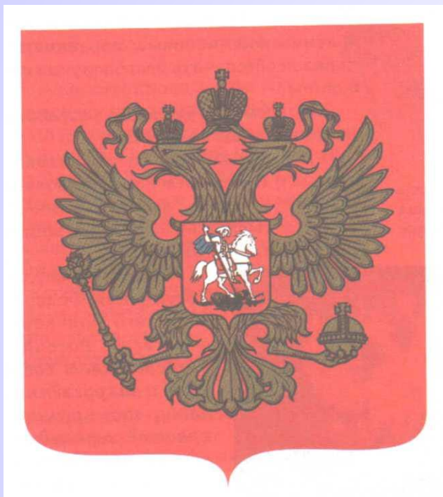
Государственный герб Российской Федерации

Герб – условное изображение, присвоенное государству, городу или знатному роду.