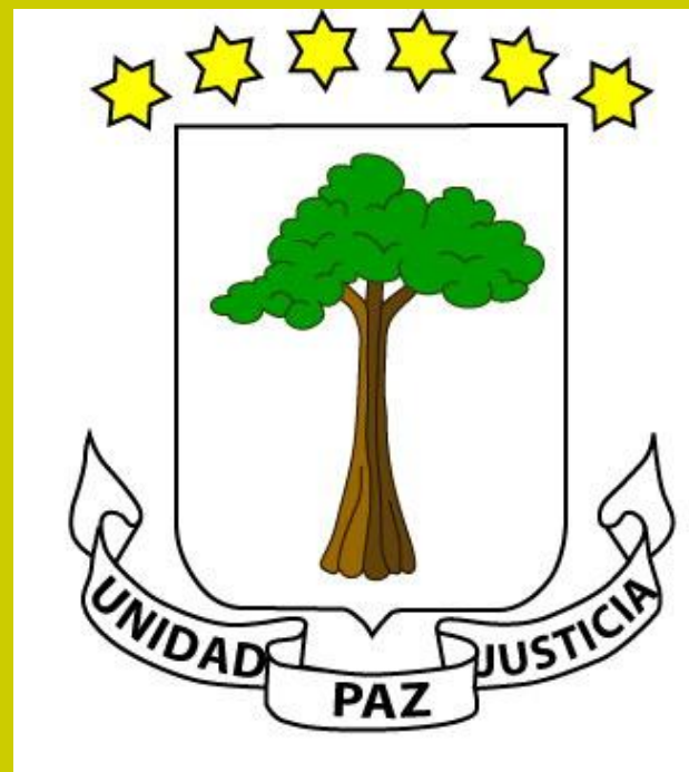
герб Экваториальной Гвинеи