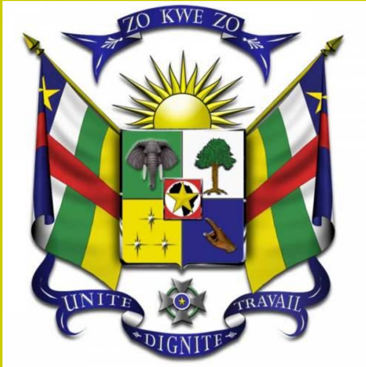
герб Африканской Республики