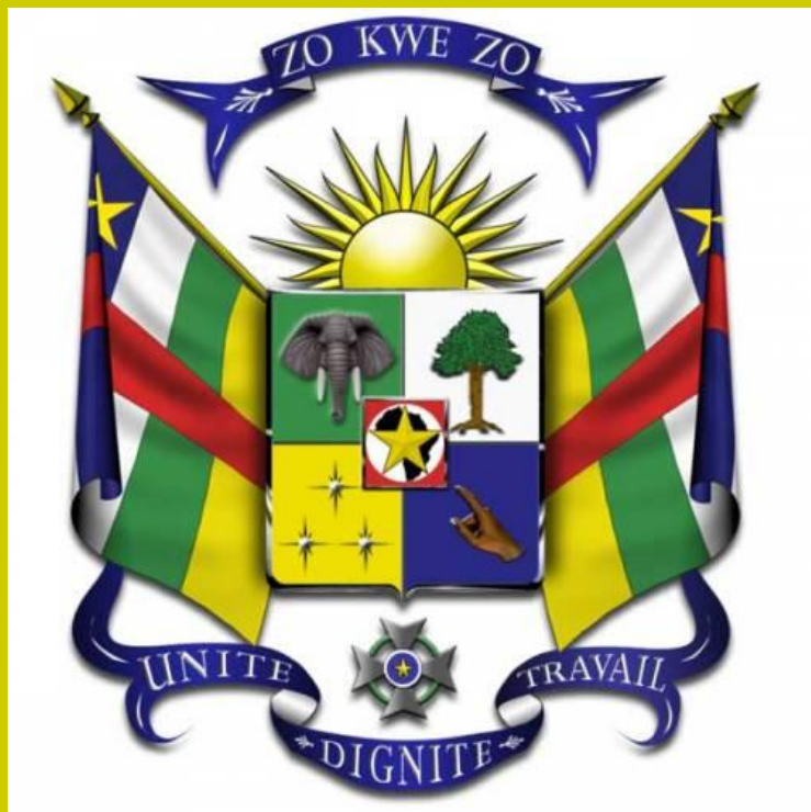
герб Африканской Республики