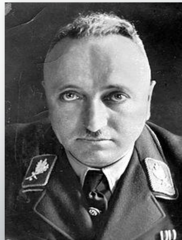
Ұйымның жетекшісі – Роберт Лей.