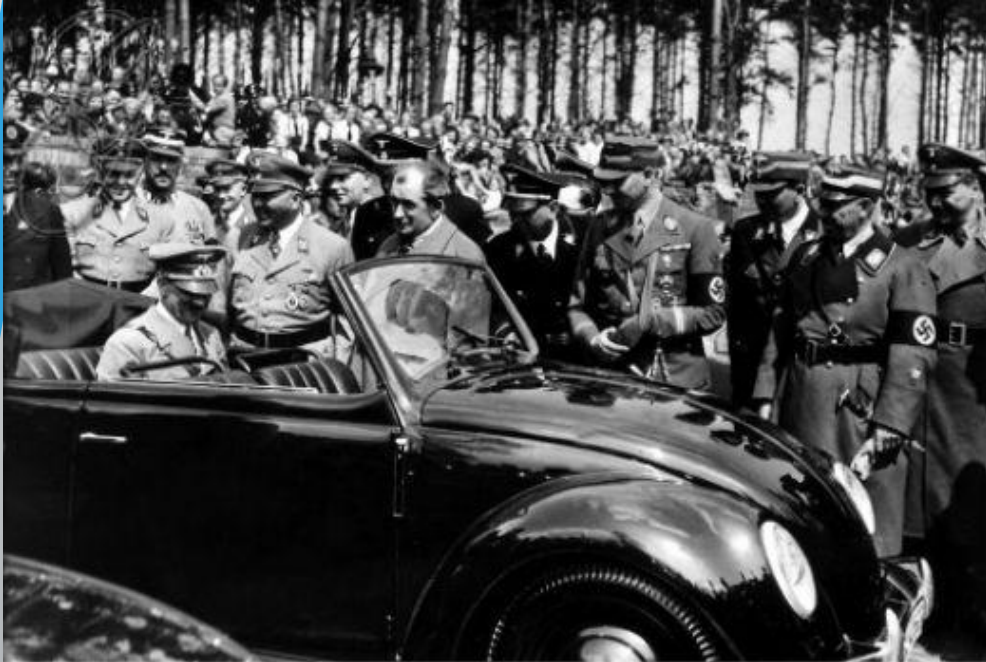
0072868 VOLKSWAGEN FACTORY, 1938.

Герман жұмыс фронты бірқатар кәсіпорындардың ашылуына негіз болды, соның ішінде герман еңбек банкі және «Фольксваген» атты алғашқы машина жасау заводы.